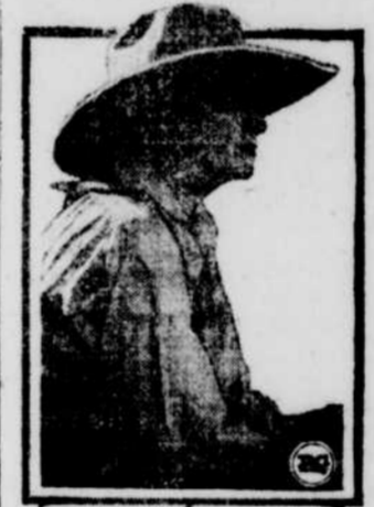
PAULINE FREDERICK in "TWO KINDS OF WOMEN" R-C PICTURES