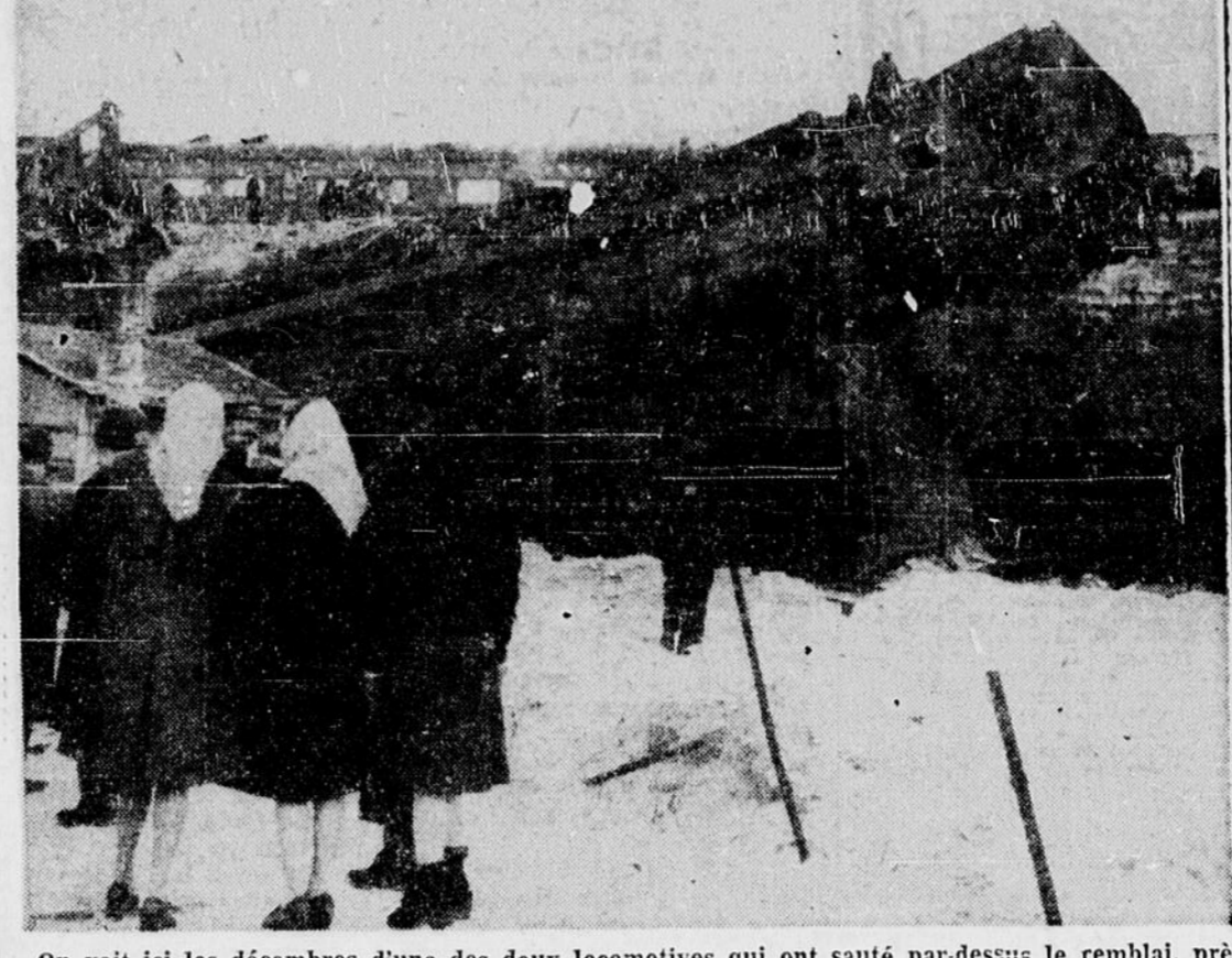
On voit ici les déambres d'une des deux locomotives qui ont sauté par-dessus le remblai, près de Brantford, tuant le chauffeur et blessant deux autres hommes de service. Ces engins traînaient un train de passagers venant de Toronto.

Morrison - Lamothe Echo Drive Bakery Limited