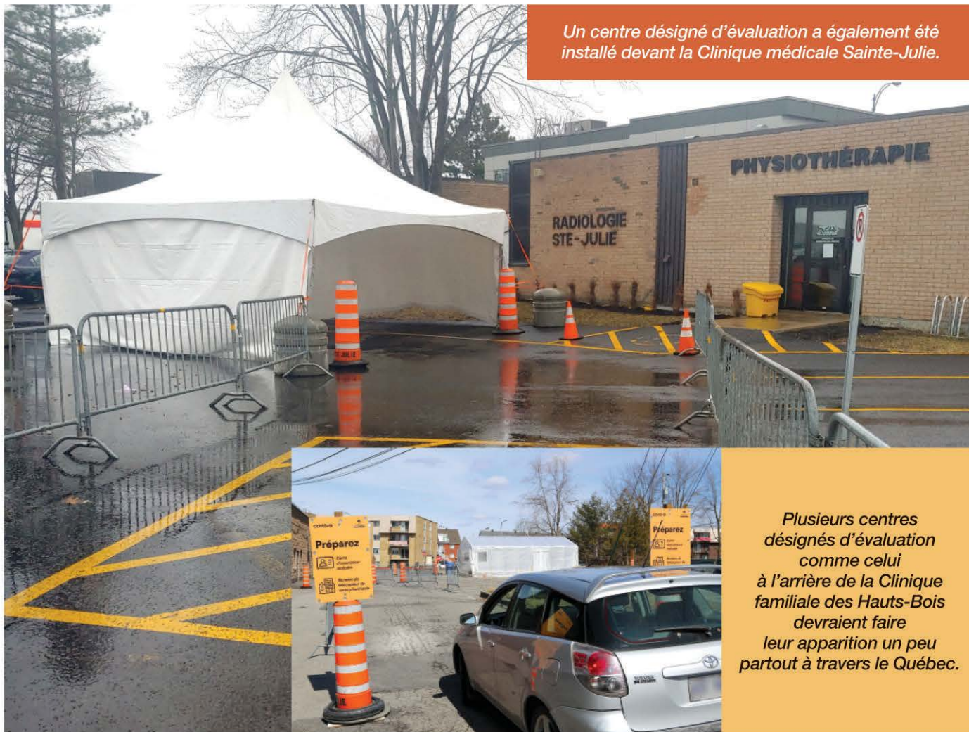
Un centre désigné d'évaluation a également été installé devant la Clinique médicale Sainte-Julie.

Plusieurs centres désignés d'évaluation du genre devraient faire leur apparition un peu partout à travers le Québec. C'est le cas à l'hôpital Notre-Dame, à Montréal, où l'on peut constater des mesures similaires alors qu'on a aménagé à l'extérieur une entrée et une salle d'attente temporaire spécialement pour les personnes atteintes de la COVID-19. L'information pertinente relative à l'ouverture des centres à Sainte-Julie sera transmise prochainement par tous les moyens de communication municipaux.