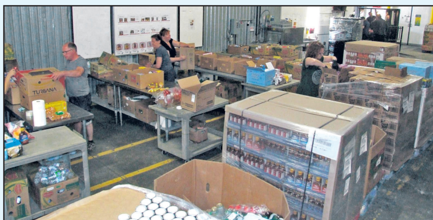
L'entrepôt de Moisson Rive-Sud.

Rappelons que le 24 février dernier, un passager infecté a voyagé à deux reprises à bord d'un autobus du RTL sur la ligne 88. (D.L)