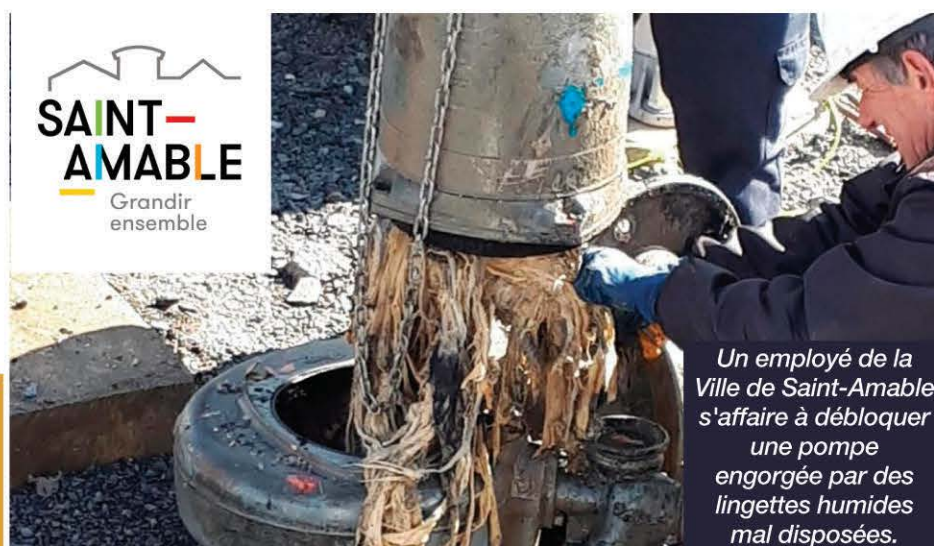
Un employé de la Ville de Saint-Amable s'affaire à débloquer une pompe engorgée par des lingettes humides mal disposées.

Liste des principaux produits responsables de l'obstruction du système d'aqueduc : lingettes