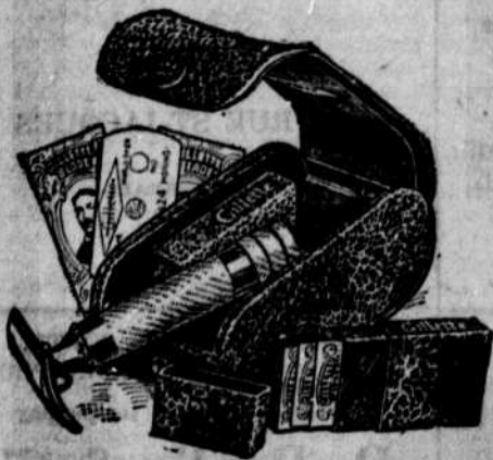
Série "Bull-dog" $5.00