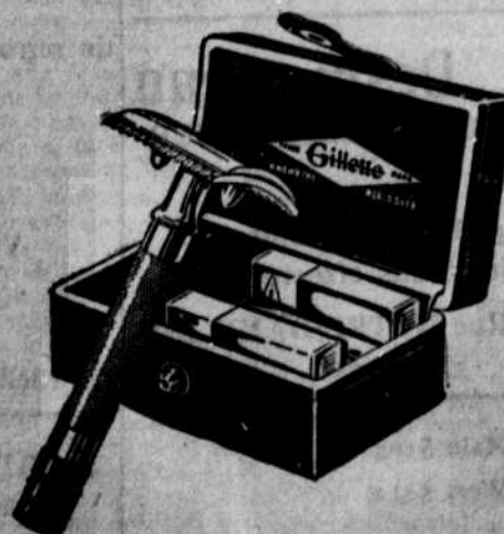
Standard Set $5.00

RAPPELEZ - VOUS : PAS D'EFFILAGE NI USAGE DE CUIR!