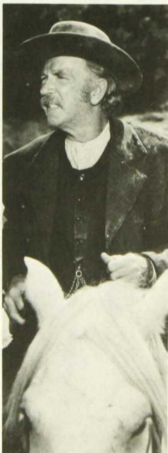
Une maison dans l'Ouest