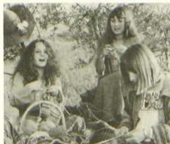
L'une chante, l'autre pas

En 1962, à Paris, Pauline, 17 ans, de bonne famille, éprise de liberté, supporte mal l'autorité parentale. Suzanne, 22 ans, fille de rudes paysans, vit précairement à Paris avec deux enfants et un photographe dévoré par son travail, mais qui se révèle incapable de la nourrir ou de lui donner le soutien et l'affection qu'elle demande. En revanche, elle est enceinte d'un troisième enfant dont Pauline, amie dévouée, l'aidera à se débarrasser, en lui prêtant l'argent nécessaire à l'avortement. Peu après, Suzanne et Pauline trouvent le photographe pendu dans sa boutique. Désespérée, Suzanne part dans le Midi vivre chez ses parents, qui la traitent comme une prostituée, et ses deux enfants comme des bâtards. Les années passent... Dix ans plus tard, les deux amies se retrouvent. Pauline chante dans un groupe yé-yé et est la maîtresse d'un Iranien, étudiant en économie. Suzanne travaille dans le Midi à un centre de planning familial.