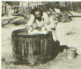
Un nommé Cable Hogue

Peckinpah a composé là un western détendu, dominé par la gaillardise et la joie de vivre. Le décor y est presque limité au seul point d'eau exploité par le héros en plein désert, et les personnages sont réduits à une demi-douzaine. Le cinéaste manifeste avec virtuosité son sens de l'image et surtout sa façon particulière d'évoquer cette époque de la fin du vieil Ouest qu'il affectionne. L'interprétation est d'un naturel savoureux.