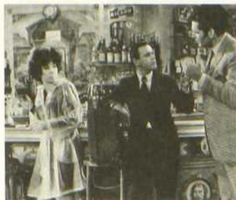
Irma la douce

Plus tard, au café Casanova, où se réunissent les Messieurs de ces Dames, il retrouve Irma, maltraitée par son dur protecteur. Son intervention galante et triomphante lui vaut l'estime du quartier et même les faveurs d'Irma. Elle le choisit comme nouveau protecteur et décide de mettre les bouchées doubles pour en faire un grand caïd. Mais Nestor est jaloux et, pour garder Irma toute à lui, il se déguise en vieux lord anglais et lui demande, contre une forte somme, l'exclusivité de sa personne. Pour payer Irma, Nestor doit travailler aux Halles en secret. Épuisé, il fait disparaître l'encombrant gentleman britannique. Un rival l'accuse alors d'avoir tué le disparu.