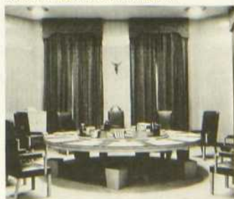
La salle du conseil exécutif

Bernard Deschatelets sera le chef de pupitre de cette émission. Réalisateur au car de reportage: Michel Lebel. Réalisateur en studio: Martin Cloutier.