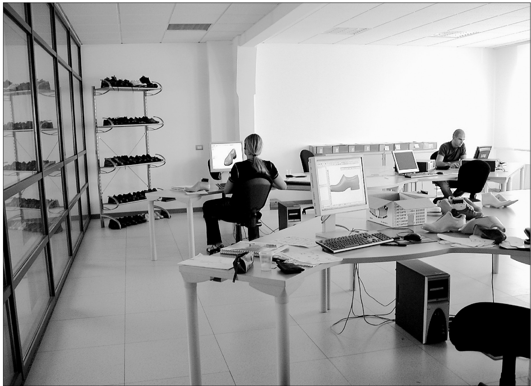
La confection de chaussures sur mesure se fait maintenant en utilisant d'abord et avant tout l'ordinateur.

Les magasins de l'avenir où l'on s'achètera des chaussures sur mesure ressembleraient au laboratoire de l'ITIA. Le client doit monter sur une plateforme de verre munis d'appareils photo numériques. En plus de prendre des photos, l'appareil enregistre les dimensions des pieds : lon-