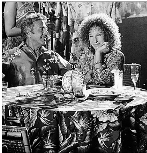
Dustin Hoffman et Barbra Streisand interprètent les personnages de Bernie et Roz Focker dans L'Autre Belle-Famille.