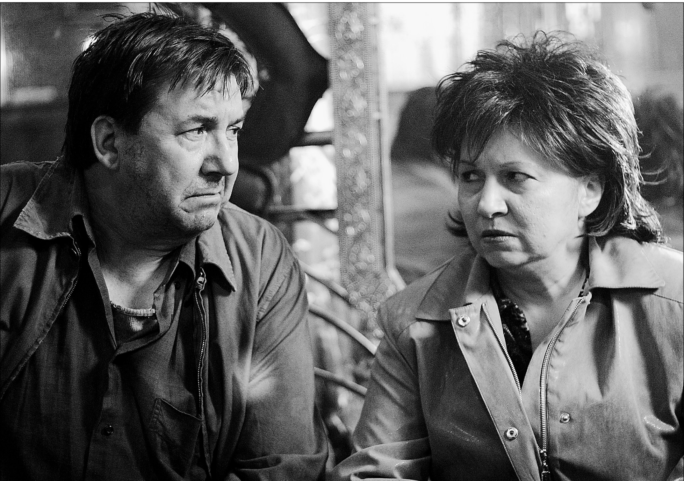
Les Bougon ressemble à une version politiquement incorrecte de Papa a raison , avec des tournures malicieuses et grossières qui feraient rougir les fans des Simpson, dit le journaliste Clifford Krauss, dans le Times .