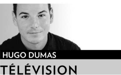
HUGO DUMAS TÉLÉVISION

Ils font passer les Simpson pour des saints, note le New York Times