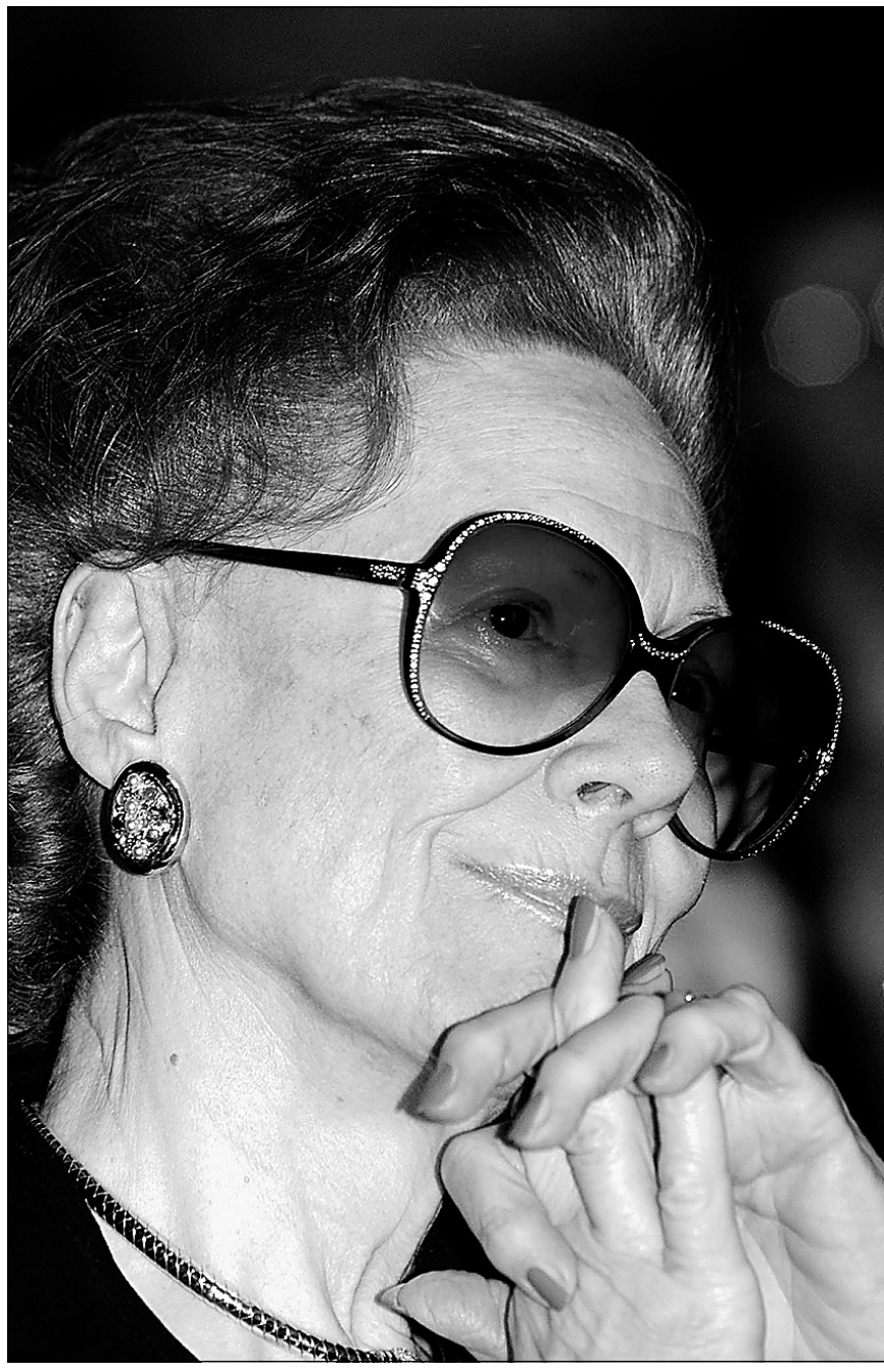
La cantatrice italienne Renata Tebaldi.