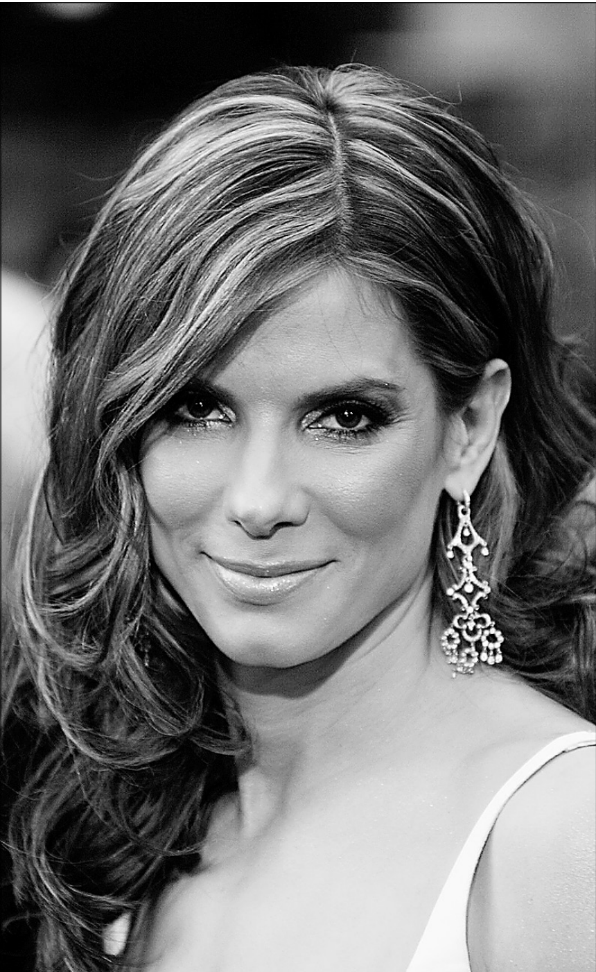
L'actrice Sandra Bullock.

Vingt-cinq ans après la conclusion de la paix avec Israël, les différentes unions culturelles égyptiennes refusent toujours toute « normalisation culturelle » avec l'État hébreu et continuent de boycotter toute production culturelle venant de ce pays.