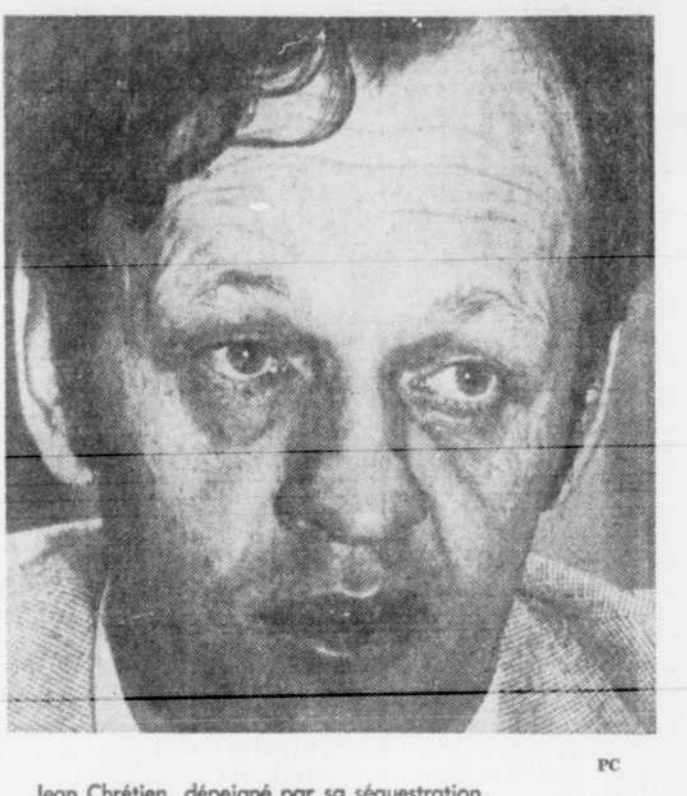
Jean Chrétien, dépeigné par sa séquestration.

SHAWINIGAN (PC) — Plusieurs dizaines de producteurs de lait ont donné suite, hier, aux avertissements qu'ils avaient faits la veille au ministre fédéral Jean Chrétien, qu'ils avaient sequestré durant plus de quatre heures dans son bureau de l'édifice fédéral. Les producteurs de lait en effet manifesté bruyamment à Saint-Boniface, déversant dans les rues du village, sur le parvis de l'église et dans tous les points publics, des milliers de gallons de lait d'un énorme camion-réservoir d'une capacité de 30.000 litres. Pour ne pas être pris de court, un autre camion, d'une même capacité, relayait le premier et en quelques heures Saint-Boniface s'est transformé en village blanc. Le point de départ fut naturellement la crémère Saint-Boniface, où les camions ont fait le plein pour revenir aussitôt à la charge dans l'intention bien arrêtée de blanchir Saint-Boniface.