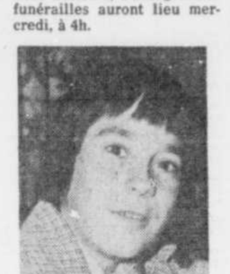
Départ de la résidence funéraire de