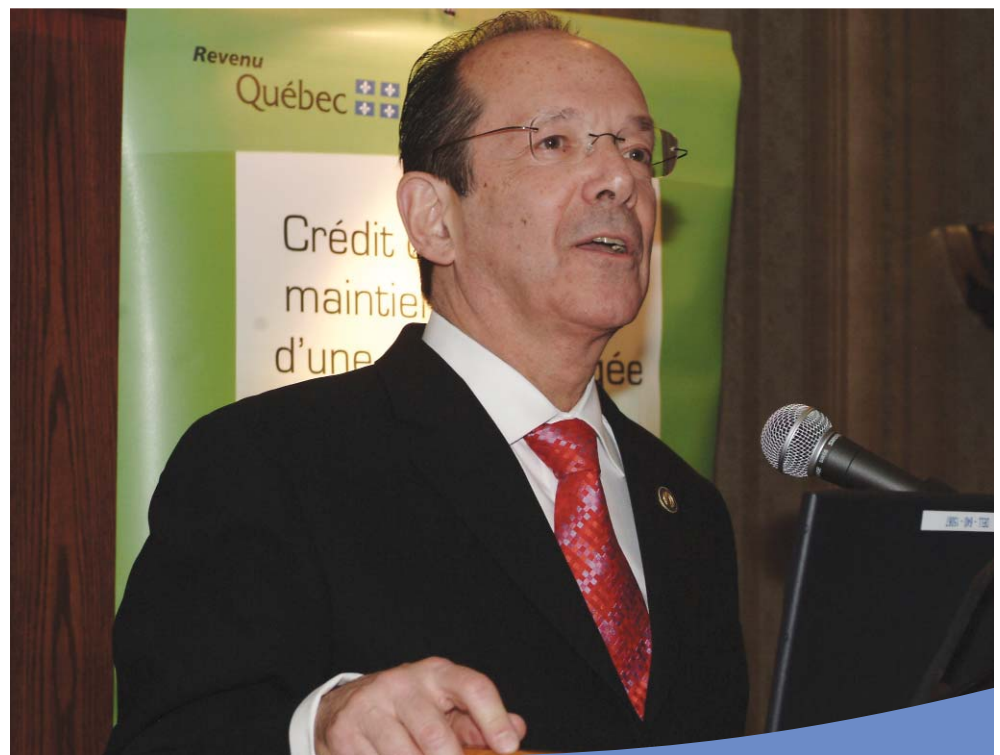
Le ministre du Revenu du Québec, M. Lawrence S. Bergman, au cours de L'événement, le 26 octobre 2006.

Vous pouvez également trouver des informations sur le site Internet du ministère du Revenu du Québec à l'adresse suivante : http://www.revenu.gouv.qc.ca/fr/ministere/index.asp . Le Ministère y a d'ailleurs mis la présentation qu'il a faite au cours de L'événement de l'ARCPQ, le 26 octobre dernier. Vous aurez accès à cette présentation via l'adresse http://www.revenu.gouv.qc.ca/documents/fr/ministere/centre_information/actualite/2006/presentation.pdf