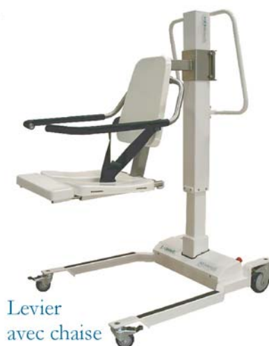
Levier avec chaise