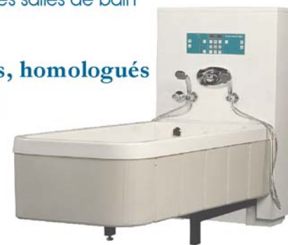
Baignoire à hauteur variable

Produits durables, sécuritaires, homologués Meilleure garantie du marché Meilleur rapport qualité/prix