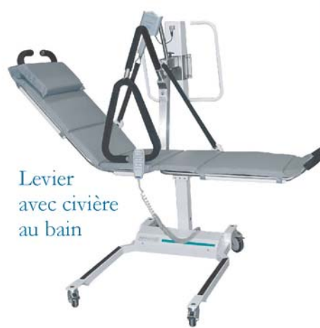
Levier avec civière au bain