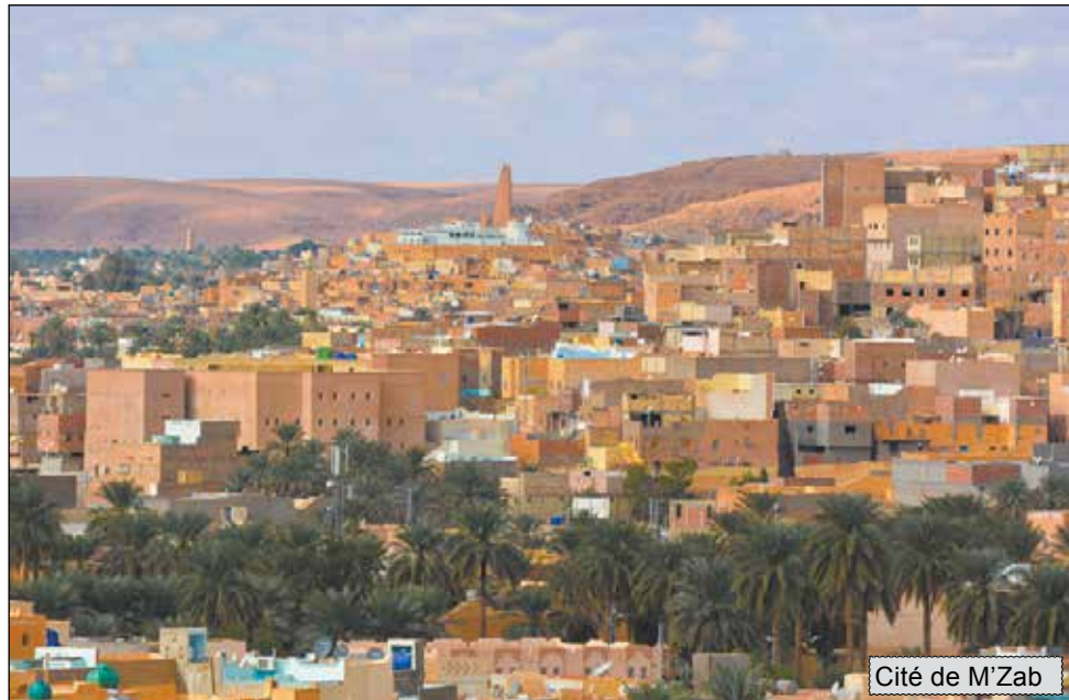
Cité de M'Zab

C omme chaque année, l'agence touristique Mzab Tours organisera cet automne, du 23 octobre au 02 novembre, le Raid des Sables d'Algérie . Une traversée du désert en 4x4 tout terrain sur 2100 kilomètres, d'Alger à Tamanrasset. L'occasion de découvrir la splendeur et la majesté offerte par les paysages naturels du riche Sahara algérien. Venez découvrir toutes les facettes de ce paradis naturel et mettez-vous en symbiose avec l'environnement du grand sud.