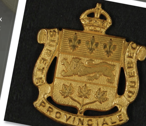
Insigne de la Sûreté provinciale dans les années 1950.