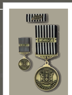
Chêne de bronze

Le Chêne de bronze récompense un employé de la Sûreté du Québec ou un partenaire qui a apporté une contribution distinguée ou qui a démontré un comportement distingué au cours d'une période prolongée ayant une incidence significative à caractère régional, provincial ou national et ayant des retombées sur un service, une division, une unité ou un poste, en association avec les valeurs institutionnelles.