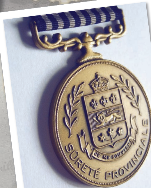
Un des derniers exemplaires de la médaille datant de 1955.