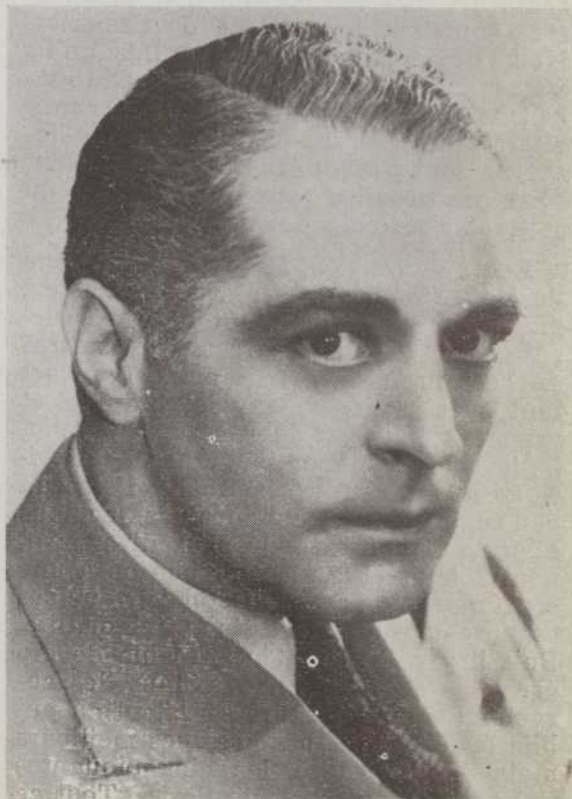
M. Marcel Journet