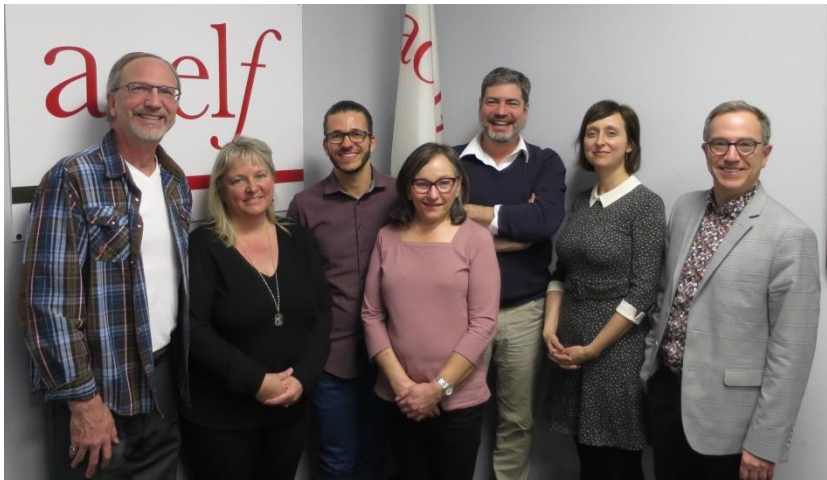
Comité de rédaction de la revue Éducation et francophonie

1 848 755 articles consultés en 2019-2020 • 5 816 personnes abonnées , dans le monde entier