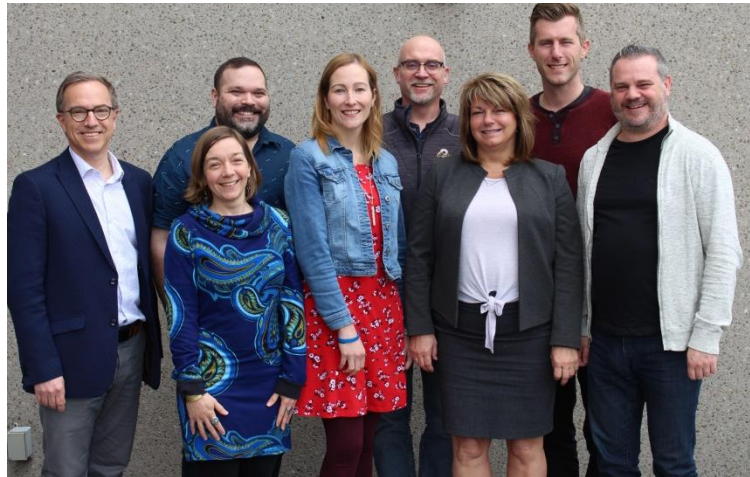
Le comité d'orientation Francosphère

En plus de ces 8 vidéos, 57 nouvelles publications ont été ajoutées dans Francosphère . Cette plateforme en construction identitaire a été consultée par 13 103 internautes cette année.