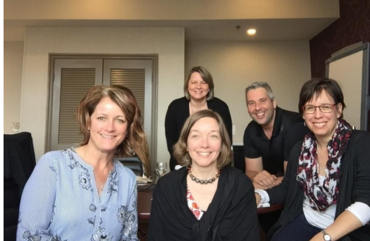
Groupe de travail BAP – 50 e Loi sur les langues officielles

En 2019-2020, le personnel scolaire a téléchargé un total de 273 103 activités de la BAP.