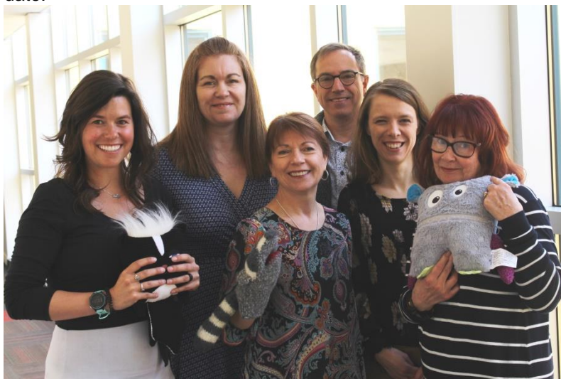
Le comité d'orientation de la SNF

De plus, les 16 nouvelles activités pédagogiques mises en ligne pour inspirer le personnel scolaire dans la Banque d'activités pédagogiques ont connu un beau succès, avec une compilation de 5 286 téléchargements . En mars, la SNF reste un moment fort de célébrations et d'affirmation dans les réseaux scolaires. Cet événement s'inscrit dans le cadre des Rendez-vous de la francophonie, un partenaire de longue date.