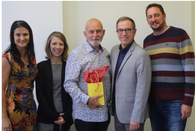
Comité d'orientation des Échanges francophones