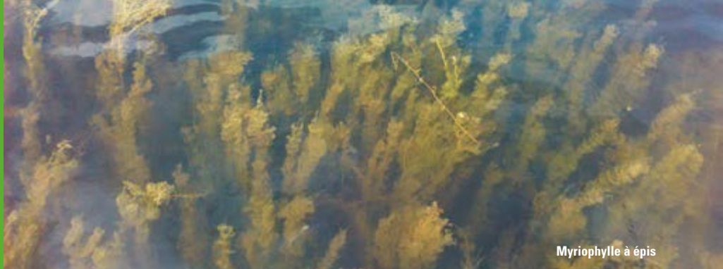
Myriophylle à épis

L'emplacement d'un objet, son contexte par rapport au site, et sa profondeur sont des informations souvent plus importantes que l'objet lui-même. Si vous trouvez un objet, laissez-le en place, notez son emplacement et avertissez le personnel du parc. Notre archéologue se rendra sur place.