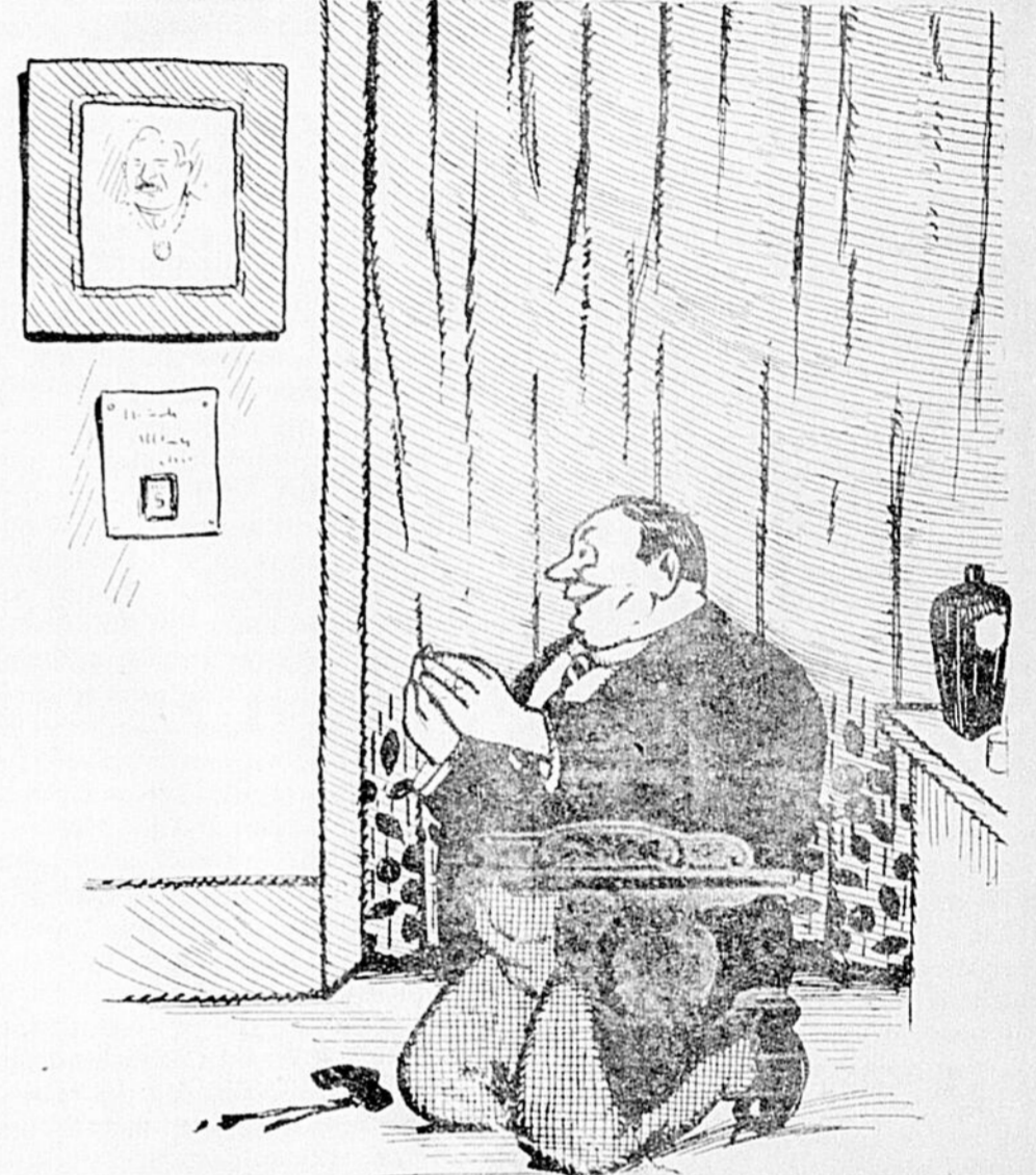
— Seigneur, je ne vous demande pas d'argent: faites seulement que je sois nommé contrôleur... ou tout au moins échevin.