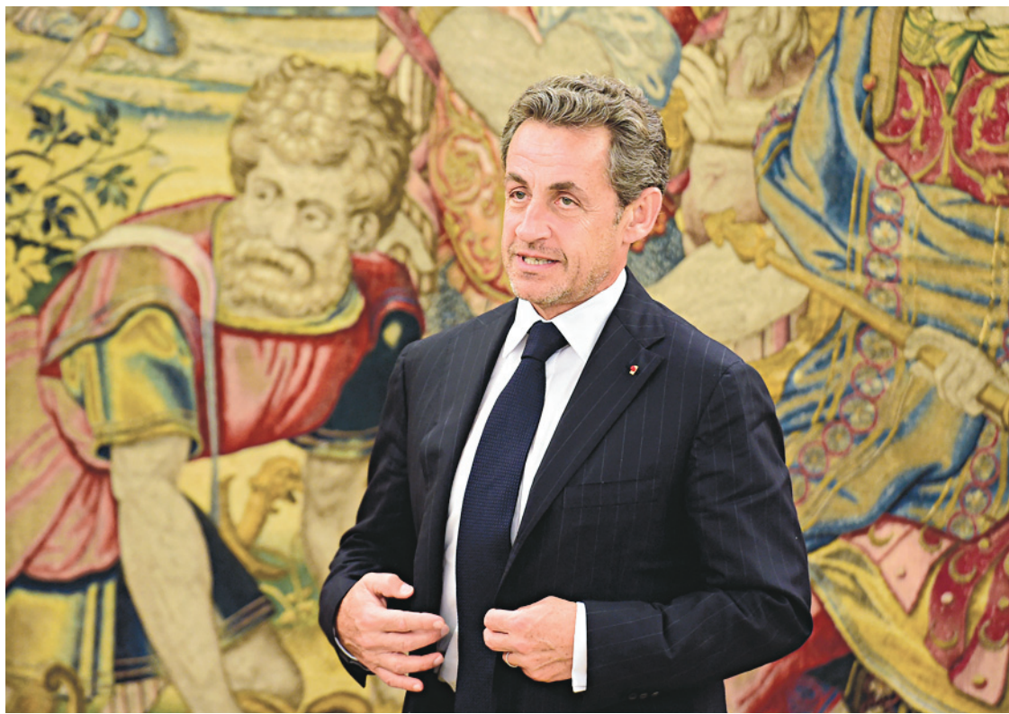
Nicolas Sarkozy s'est rendu en Espagne, mercredi, où il a rencontré le roi Juan Carlos.

« S'il savait, il a triché massivement, et s'il ne savait pas, quel chef peut laisser passer un wagon avec 10 millions d'euros dedans : il y a dans ce cas-là un problème d'incompétence. Quand vous avez le choix entre