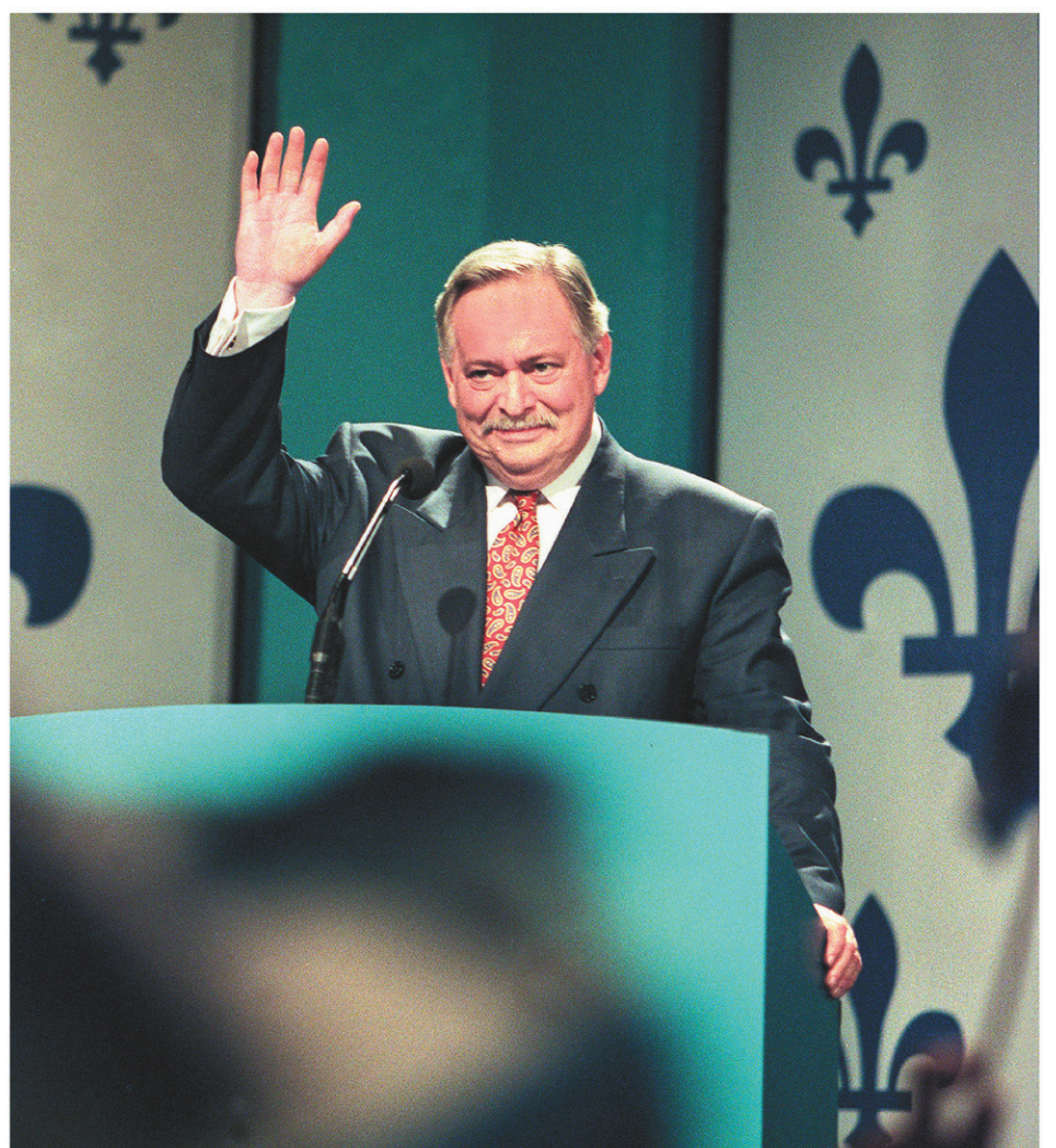
30 octobre 1995. Après l'écoute des résultats, Jacques Parizeau s'adresse aux militants du Oui au Palais des congrès de Montréal.

Lire aussi · Ce 1 er janvier, j'ai pleuré. Une lettre ouverte publiée dans la section Idées. Page A 7