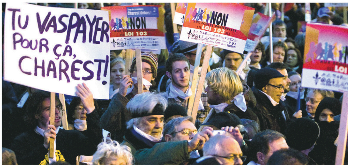
Près de 2000 personnes avaient manifesté en octobre 2010 contre l'adoption de la loi visant à encadrer les écoles passerelles (le projet de loi 103, devenu le projet de loi 115) devant les bureaux de Jean Charest à Montréal.