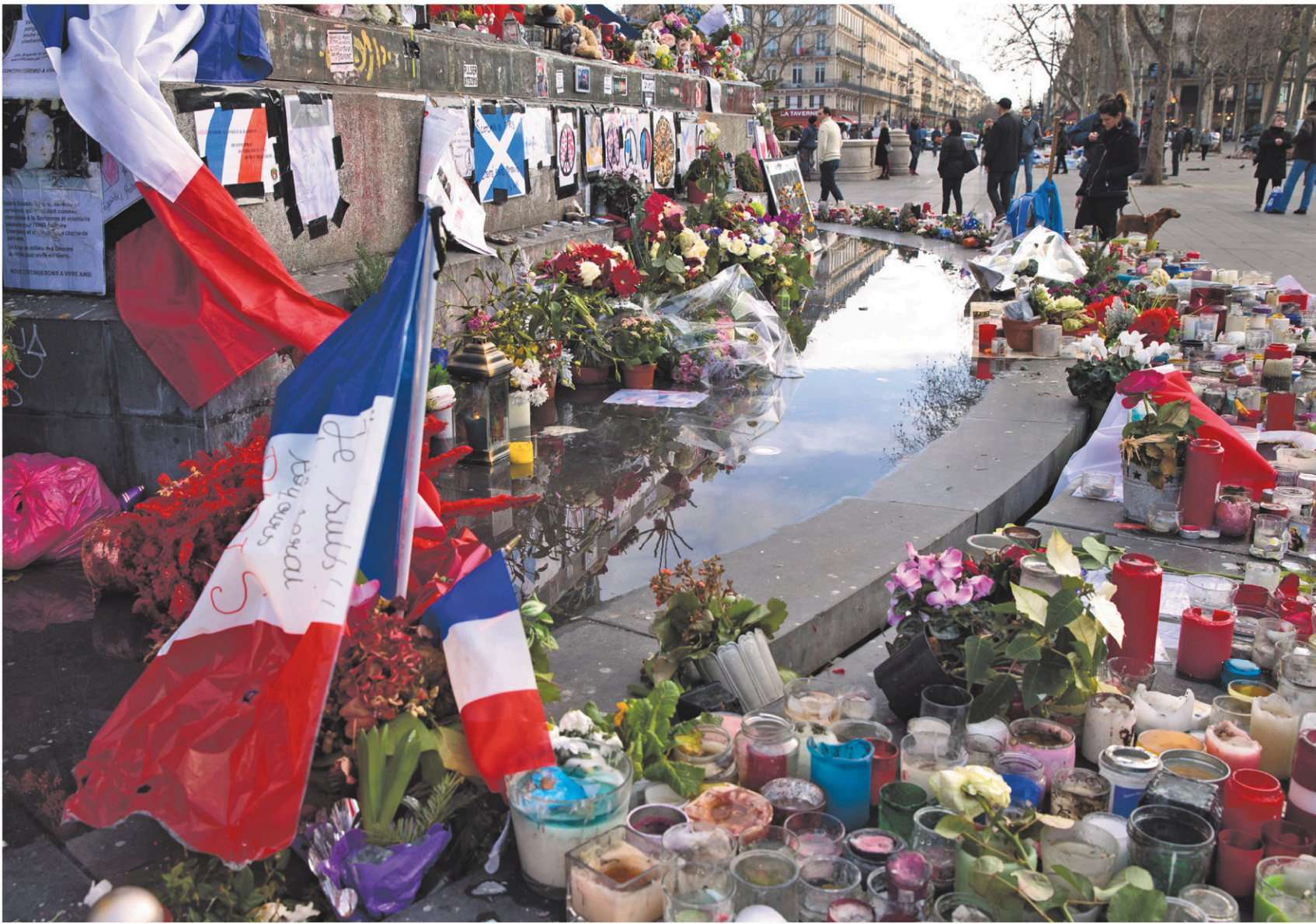
Des bougies, des dessins et des drapeaux ont été déposés lundi au pied de la statue de Marianne, sise place de la République à Paris, pour rendre hommage aux victimes des attentats du 7 janvier 2015. Le lieu en est aussi un de commémoration pour les victimes des attaques de novembre dernier.

L'ATTENTAT CONTRE CHARLIE HEBDO , UN AN PLUS TARD