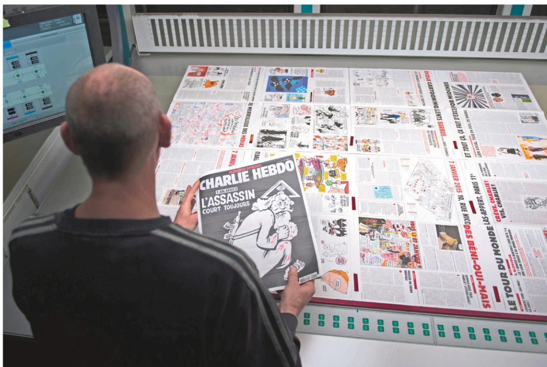
Un employé d'une imprimerie située près de Paris scrute les pages de l'édition spéciale de Charlie Hebdo qui sera en kiosque en France dès mercredi.

Dans la classe politique, plusieurs élus de droite et de gauche ont aussi défendu la liberté de blasphémer de Charlie Hebdo. D'autres, comme l'ancienne ministre de droite Rachida Dati, se sont dits « heurtés ».