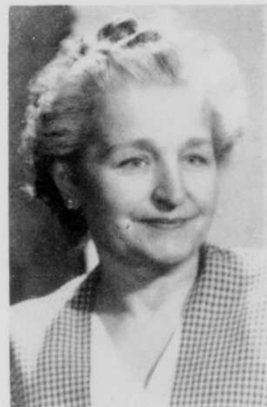
GERMAINE GUÉVREMONT, romancière de grand talent, est l'une des femmes de lettres les plus connues des téléspectateurs. L'adaptation de son livre Le Survivant a remporté sous le même titre le plus vif succès. La suite de cette attachante intrigue, intitulée Au Chenal du Moine, a retenu l'attention d'un vaste public qui a maintenant hâte de connaître l'héroïne et les personnages du dernier téléroman de Germaine Guévremont. Marie-Didace, dont la première émission sera présentée jeudi 25 septembre, à 8 h. 30 du soir, au réseau français de télévision de Radio-Canada.

On notera que, le même jour, l'Actualité sera présentée à 5 h. 30 de l'après-midi au lieu de 6 h. 30, jusqu'au 12 octobre, date à laquelle cette émission passera sur nos écrans à 6 heures du soir.