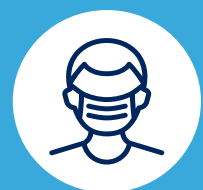
Portez un masque