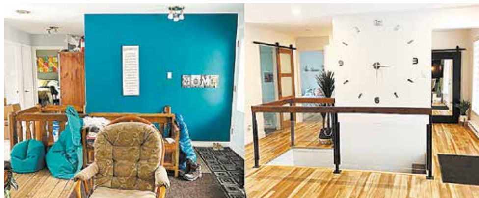
Superbe avant-après d'un relooking intérieur fait à L'Ange-Gardien.

info@relookinextenso.com https://www.relookinextenso.com/ (418) 559-7776