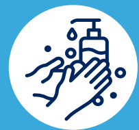
Lavez vos mains