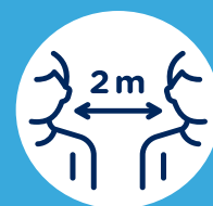
Gardez vos distances