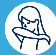
Toussez dans votre coude

Le port du masque est obligatoire lors d'une consultation.