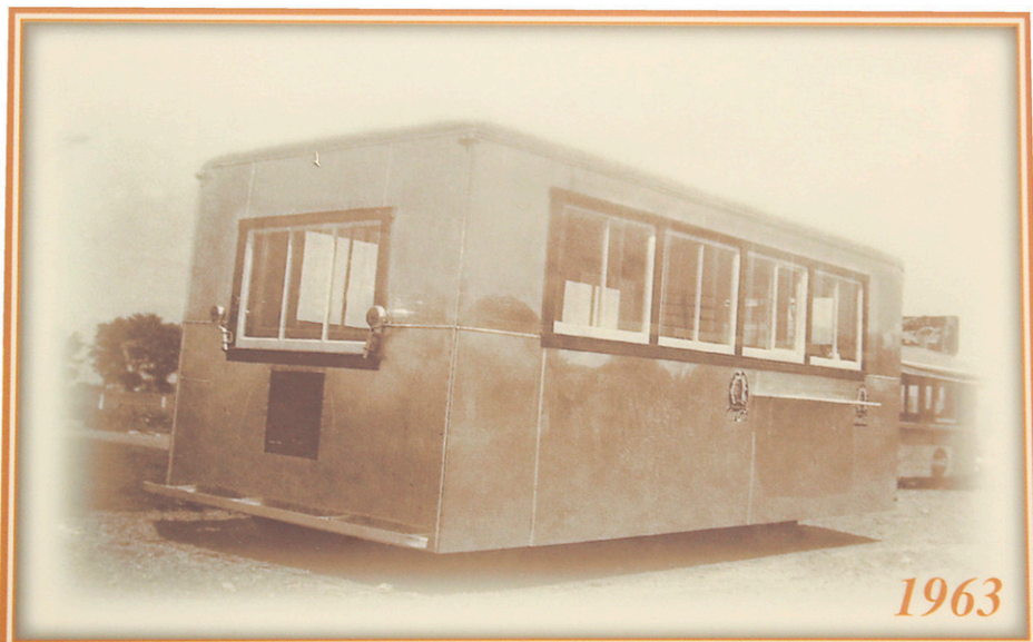
La Cantine Normandin en 1963, à ce moment, la cantine était mobile.