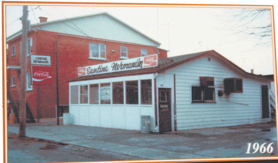
La Cantine Normandin en 1966.

stationnement municipal que la Cantine a ouvert ses portes. Suite à l'enthousiasme qu'elle a suscité auprès de ses clients, elle emménagea, rue Union, à proximité de l'édifice des Chevaliers de Colomb. Et c'est en 1982 qu'elle s'est installée à son emplacement actuel, au 1100 Union.