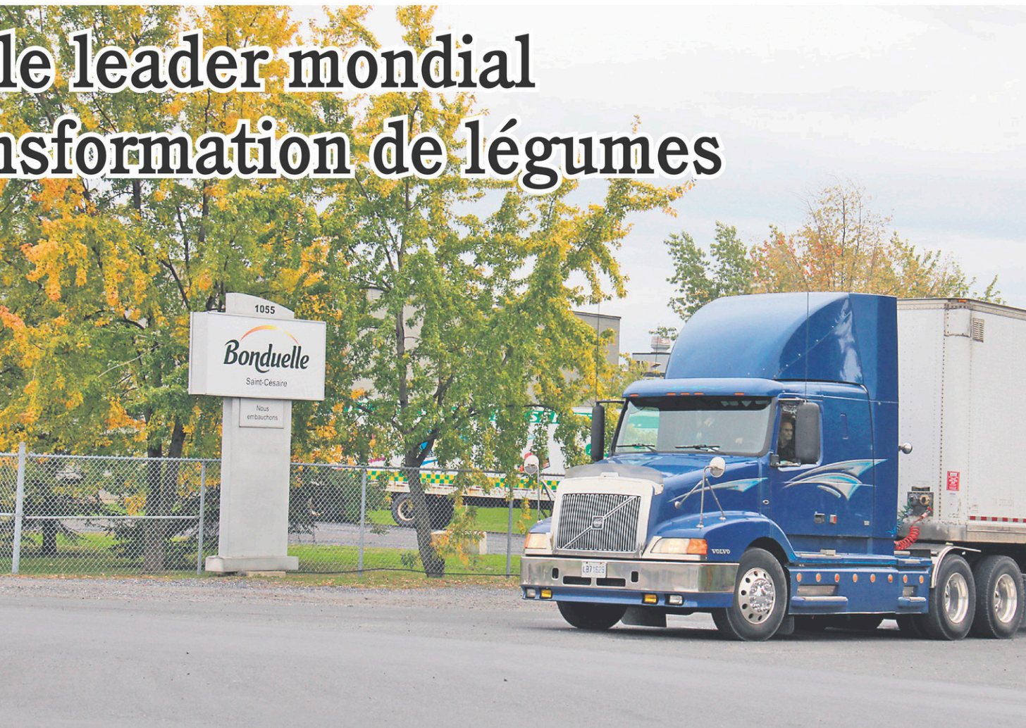
L'usine de Bonduelle à Saint-Césaire est l'une des plus productives en Amérique du Nord.

Bien que Bonduelle Amérique du Nord se spécialise dans la transformation des légumes, elle produit également une gamme de fruits surgelés, de soupes, de fèves au lard et de légumineuses. Ces produits se retrouvent sur nos tablettes sous les marques privées des grands distributeurs ou sous ses propres marques. Elle est reconnue pour la qualité de son service, la qualité de ses produits et pour ses réseaux éprouvés de commercialisation.