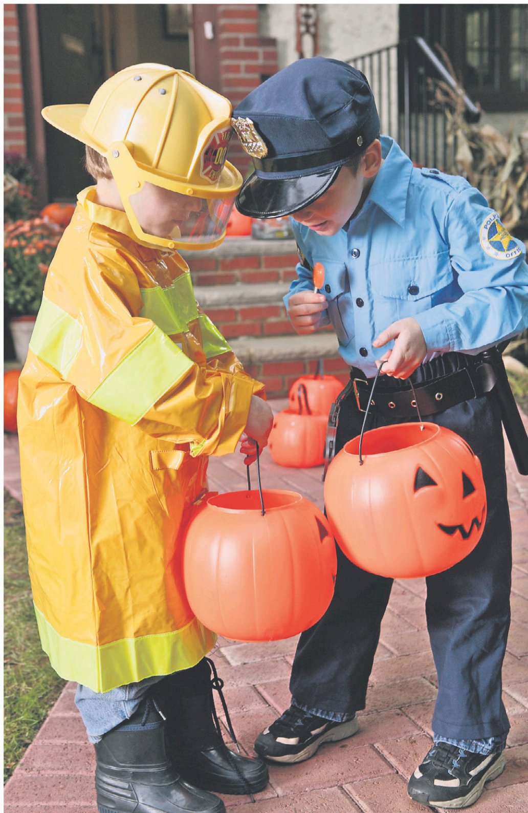
La fête de l'Halloween est toujours très courue dans la municipalité. Les jeunes pourront courir aux portes de 16 h à 19 h afin de recevoir des friandises.

► Journée de l'arbre , à la mi-mai 2014 (date à venir). Distribution d'arbres gratuits à l'hôtel de ville.