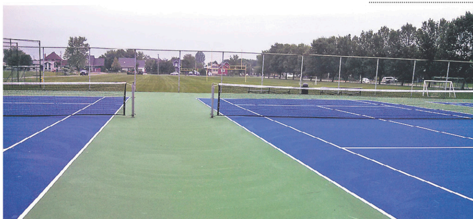
La base asphaltée des terrains de tennis a été refaite, puis recouverte d'un revêtement en acrylique.