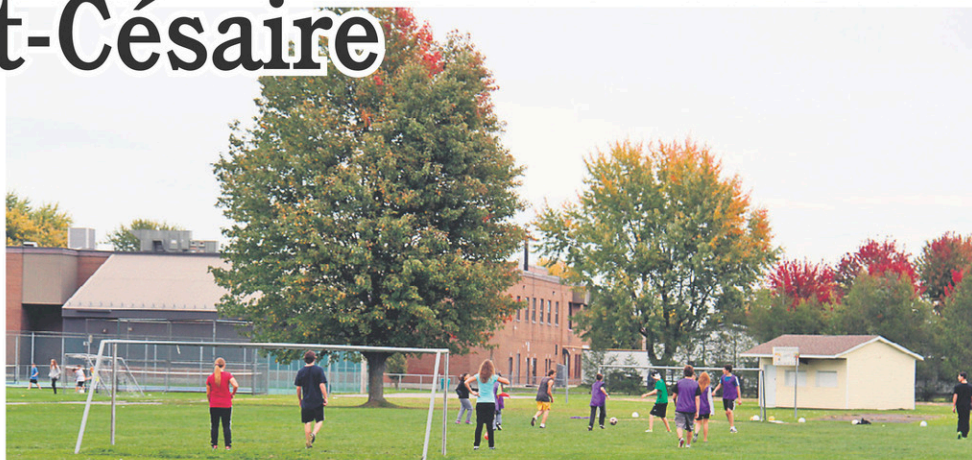
Depuis le mois d'août, les férus de soccer peuvent pratiquer leur sport coup de cœur sur de nouveaux terrains, qui comptent parmi les installations sportives les plus populaires.

Enfin, toutes ces améliorations se sont aussi traduites par une année record d'inscriptions aux camps de jour de Saint-Césaire cet été. « Nous avons en effet eu plus de 250 inscriptions, soit une soixantaine de plus que l'été 2012, dont 90 % étaient des résidents de Saint-Césaire. La mise à jour de nos infrastructures y a certainement contribué, tout comme l'excellent travail des membres de l'équipe de gestion, d'entretien et d'animation. »