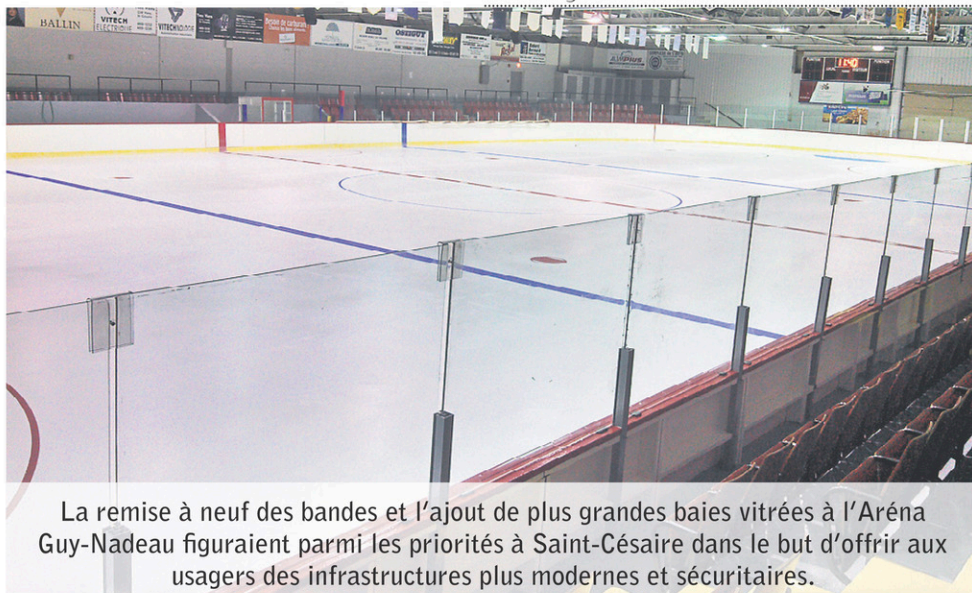
La remise à neuf des bandes et l'ajout de plus grandes baies vitrées à l'Aréna Guy-Nadeau figuraient parmi les priorités à Saint-Césaire dans le but d'offrir aux usagers des infrastructures plus modernes et sécuritaires.