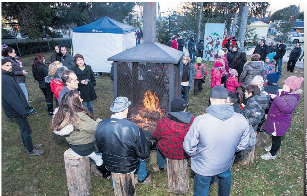
Il sera possible de se réchauffer autour d'un feu extérieur.

Au programme, des prix de présences seront offerts, ainsi qu'une nouveauté cette année, le défilé du père Noël dans les rues de la Ville de Saint-Gabriel.