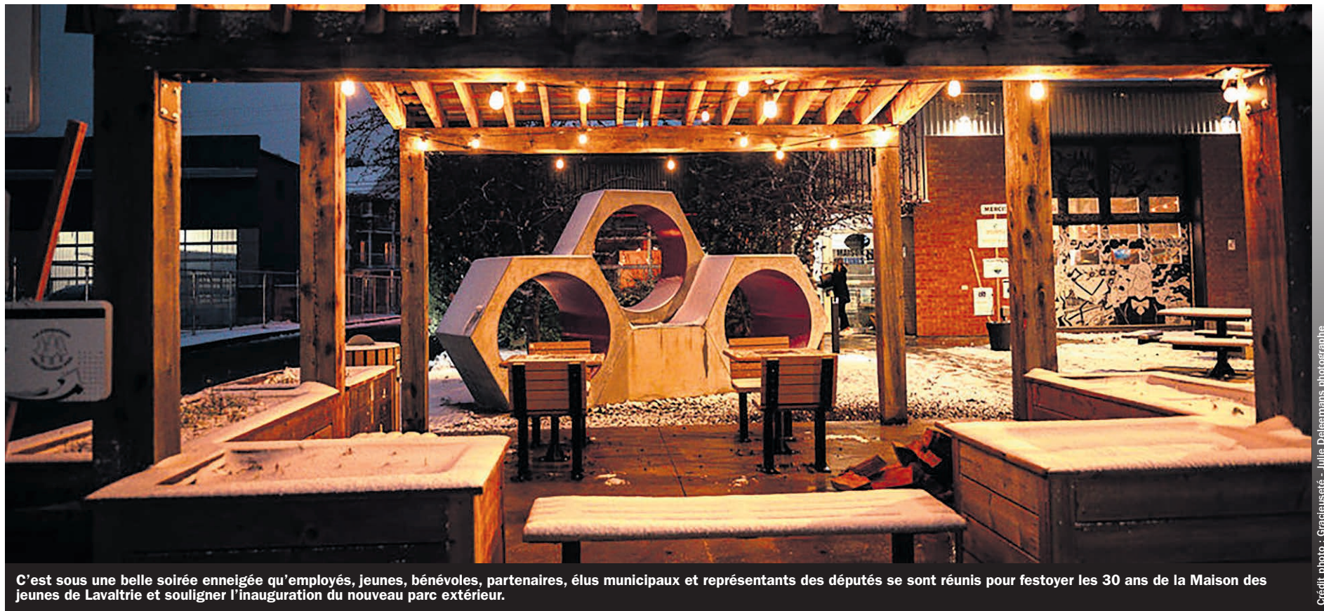
C'est sous une belle soirée enneigée qu'employés, jeunes, bénévoles, partenaires, élus municipaux et représentants des députés se sont réunis pour festoyer les 30 ans de la Maison des jeunes de Lavaltrie et souligner l'inauguration du nouveau parc extérieur.