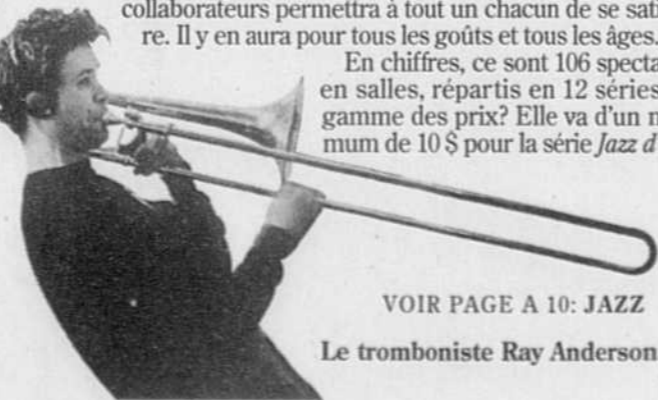
VOIR PAGE A 10: JAZZ