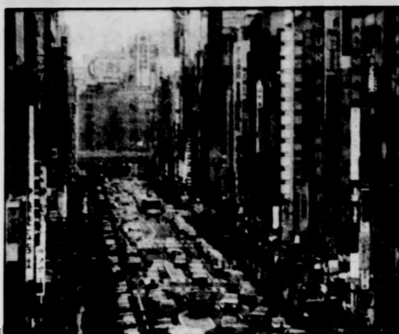
Il ne faut pas avoir peur des foules pour magasiner à Tokyo.

Plus loin se trouve le Tori Shige, excellent restaurant yakitori qui sert grillades et brochettes.