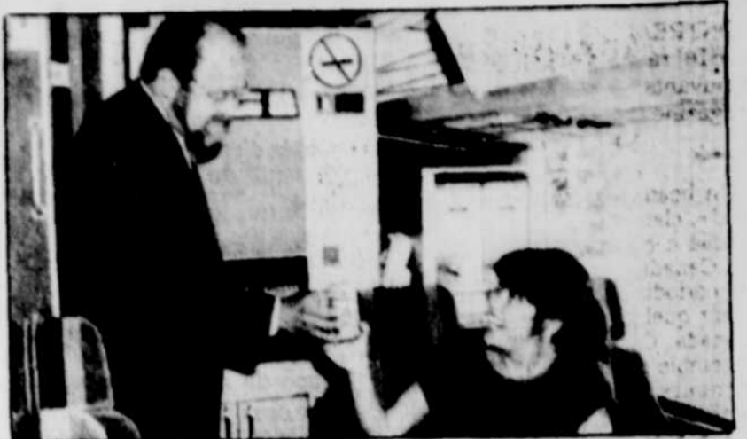
Les transporteurs offrent une gamme de nouveaux services : rafraichissements, repas, vidéos, etc.

« Les résultats furent immédiats », constate Munro dans un éclat de rire. « Maintenant, le per-