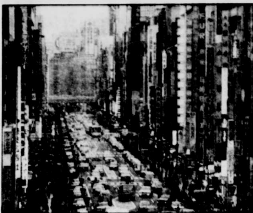
Il ne faut pas avoir peur des foules pour magasiner à Tokyo.

Plus loin se trouve le Tori Shige, excellent restaurant yakitori qui sert grillades et brochettes.