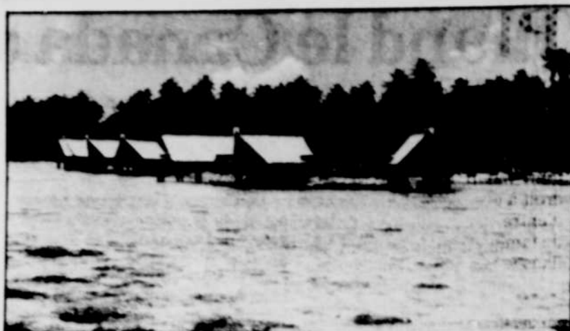
À Tahiti, il n'est pas rare de voir des maisons construites sur pilotis, mais ici c'est l'hôtel Koho Chaze.

« Aux îles Cook, seuls deux atolls peuvent se plier aux exigences de cet élevage. C'est donc très limité. Les perles produites jusqu'alors là-bas sont certes noires, mais elles ont un orient jaune-chocolat, à l'opposé de l'orient rose-vert des nôtres, qui nous a valu un véritable engoue-