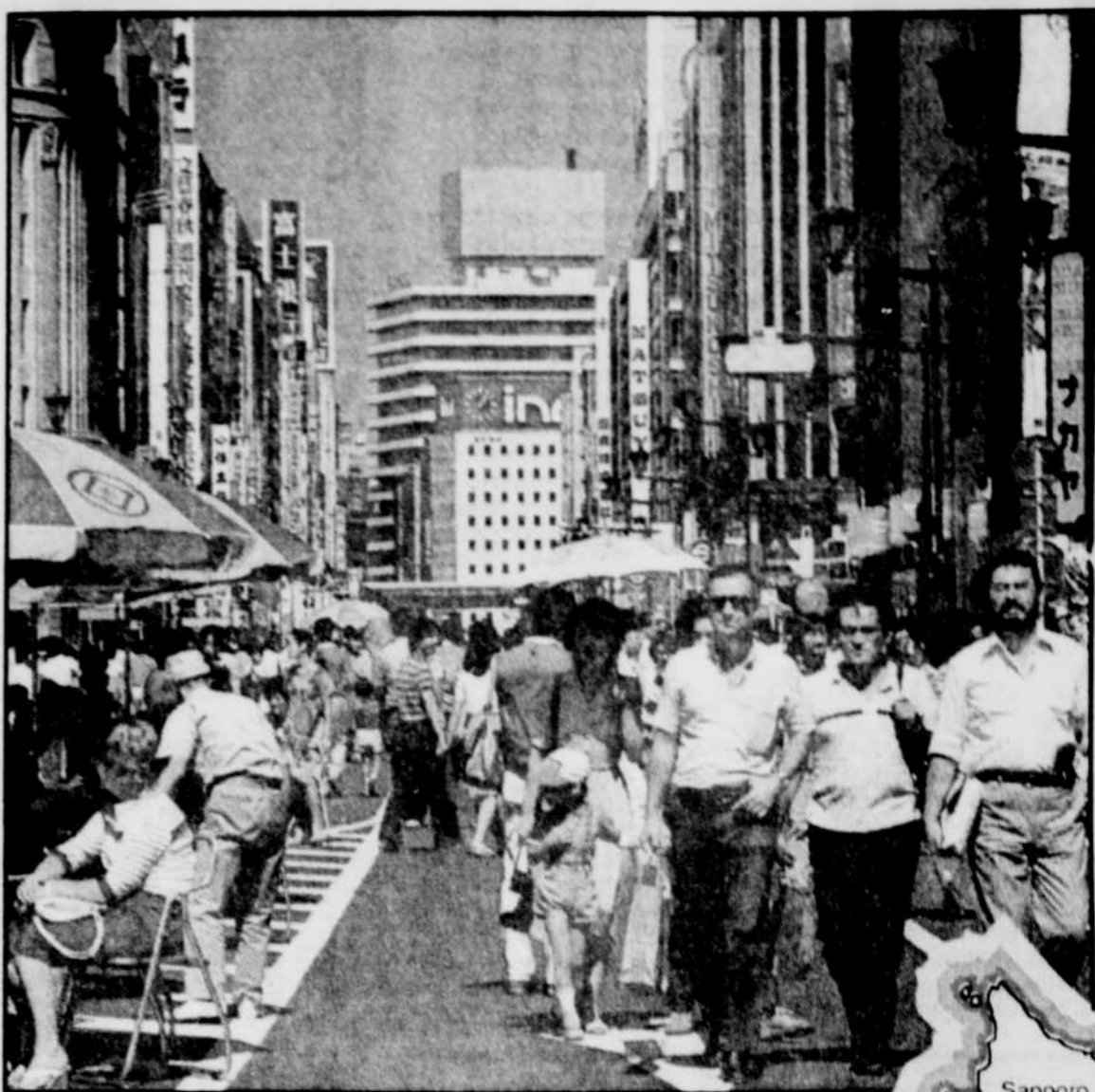
Ginza est un quartier riche en petites rues bordées de boutiques spécialisées.

Tokyo célèbre les origines rurales des Japonais tout l'automne, au cours de festivals inusités, ou matsuri .