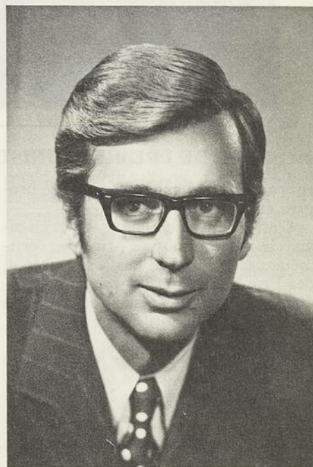
Hon. Robert Bourassa Premier Ministre du Québec

Je profite donc de la Rosh Hashanah 5734 pour souhaiter que tous les Québécois, quelle que soit leur croyance, soient inscrits au Livre de la Vie et connaissent ainsi une année de paix, de progrès et de bonne santé.