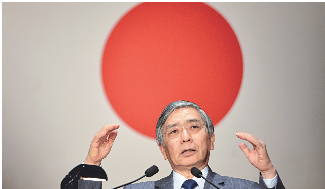
Le numéro 1 de la Banque du Japon, Haruhiko Kuroda

De l'autre côté, la Banque du Japon a tiré un grand coup de son bazooka monétaire la semaine dernière également, en annonçant un accroissement de son propre programme de rachat d'actifs, alors que l'archipel stagne et que son inflation reste désespérément basse. « Le traitement doit être administré jusqu'au bout ».