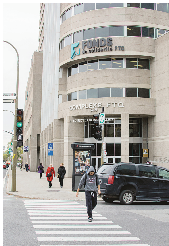
MICHAËL MONNIER LE DEVOIR

Le Fonds de solidarité rompt avec sa tradition en annonçant ses perspectives d'investissement pour les prochaines années.