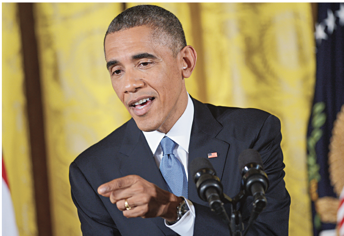
Barack Obama a commenté mercredi les résultats de l'élection de la veille.