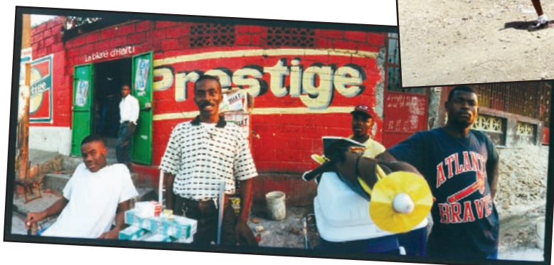
Marché de Pétion-Ville, avril 2000