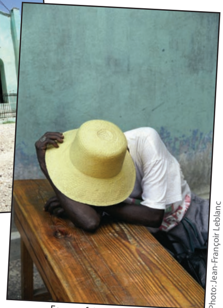
Femme faisant une sieste avant la réunion des Femmes Paysannes de Petites-Rivières-de-Nippes.