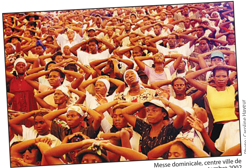
Messe dominicale, centre ville de Port-au-Prince, septembre 2002

Le vernissage de l'exposition Comment ça va? a lieu dans l'Espace SSQ de la TOHU le vendredi 18 janvier à 18h en présence des artistes.