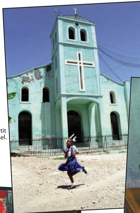
Une des églises de Petit Mouillage près de Jacmel.