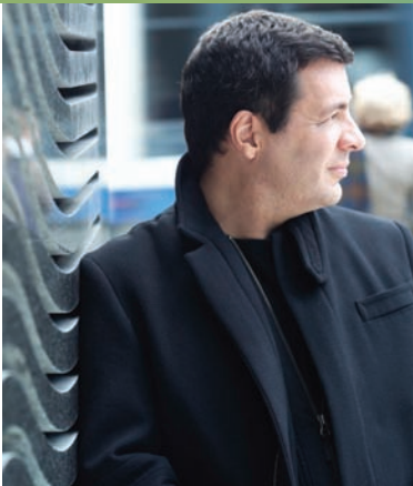
Benoit Labonté Maire de l'arrondissement de Ville-Marie