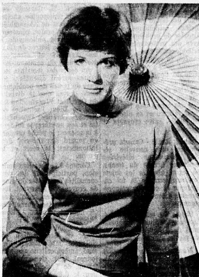
JULIE ANDREWS — La populaire comédienne et chanteuse Julie Andrews sera la vedette du "Walt Disney's Special Christmas Show" que l'on pourra voir le jour de Noël à CJOH. Elle visitera Disneyland au cours de l'émission et montrera, avec l'aide de Dick Van Dyke, des scènes du film "Mary Poppins".

Rappelons que cette émission est présentée chaque samedi soir à 7 heures.