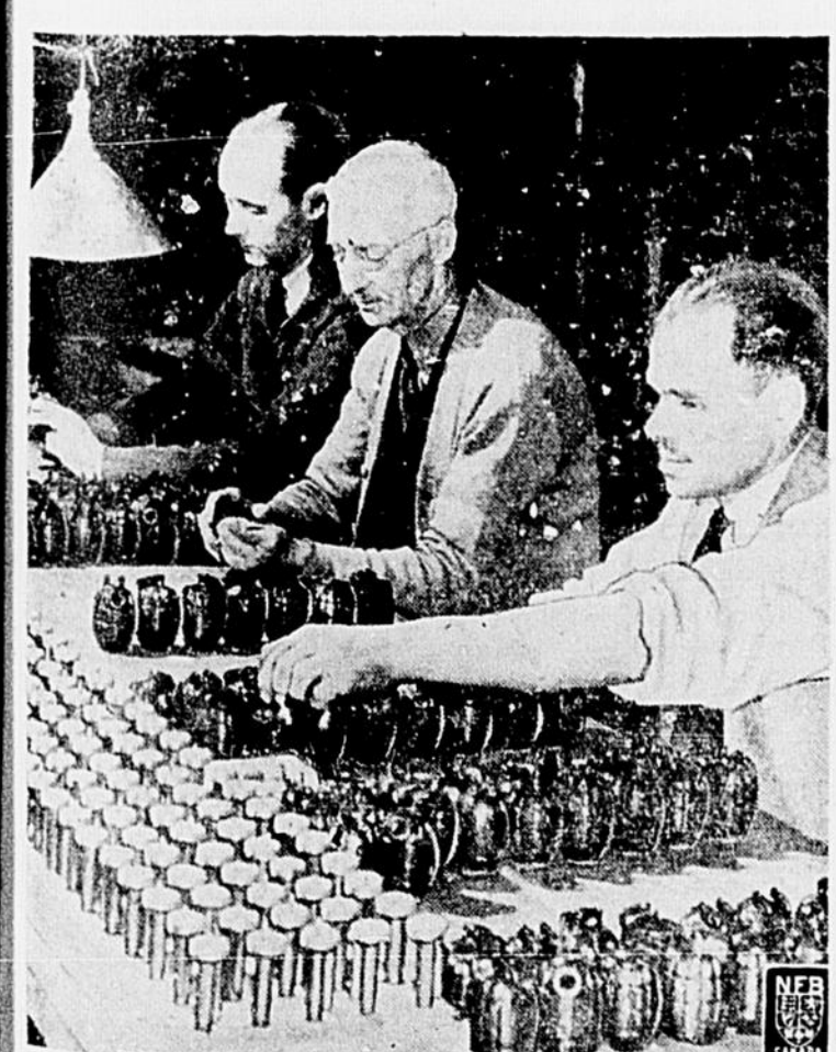
LES INSPECTEURS TANT DE L'USINE QUE DU GOUVERNEMENT SONT A VERIFIER DES GRENADES

A mesure que dure la guerre, l'effort industriel du Canada augmente. Il y a déjà longtemps que toutes les industries importantes susceptibles d'être mises au service de la cause Alliée ont été converties en usines de guerre. Mais voilà que la petite industrie, la fabrique régionale ou souvent municipale, l'atelier indépendant, se tournent eux aussi vers la production de guerre.