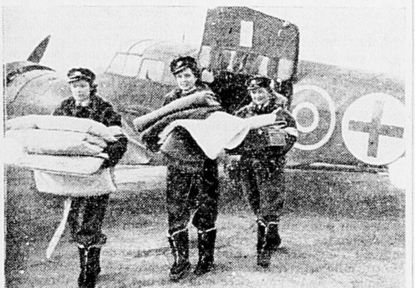
Trois aides infirmières de la WAAF britannique. Elles ont des devoirs bien définis, et doivent secourir les blessés, de même qu'elles doivent servir d'ambulancières aériennes pour le transport d'aviateurs blessés, et stationner dans des endroits reculés, vers des centres bénéficiant naturellement de facilités d'hospitalisation plus adéquates. Elles sont vêtues de la même façon que les pilotes de la R.A.F., et reçoivent une allocation de vol en plus de la solde régulière.