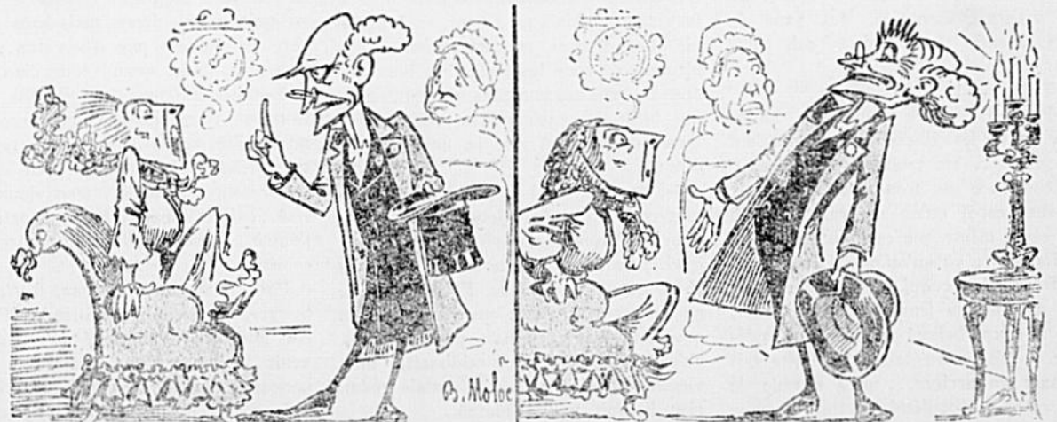
— Madame, ce que vous avez de mieux à faire à l'heure qu'il est, c'est d'envoyer chercher un notaire et un prêtre. — Docteur! Je suis perdue, je le vois bien !!!