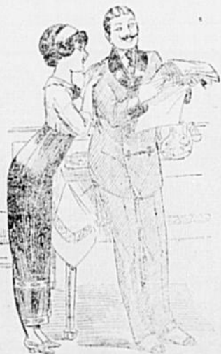
—Tu lis la "Presse"?... Moi, je lis la "Patrie"... il y a bien plus de vic-