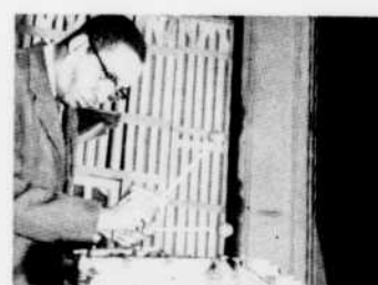
Mercredi à 10 h. 15, Milt Jackson à "Jazz d'aujourd'hui".