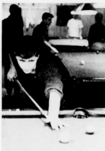
Ne pas oublier à 9 heures, "8 témoins", documentaire sur la délinquance, de Jacques Godbout.

"La Mort de Staline", documentaire de Len Giovanetti. La mort de Staline et sa répercussion sur l'évolution de la guerre froide entre son pays et les Etats-Unis.