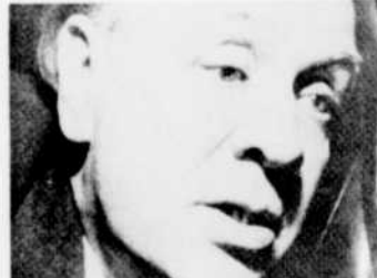
Jorge-Luis Borges à l'émission "Les auteurs étrangers", mercredi à 9 h. 30, à la radio.