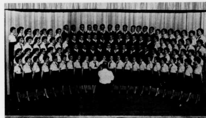
Le chœur V'là l'bon vent que l'on entendra à l'émission "Ad lib", à 4 h. 45.

11.00—Les Mensonges d'Ulysse 11.15—Démons et merveilles CBAF—Détente 11.30—CBAF—Météo et fin des émissions 12.00—Radiojournal CBJ—Fin des émissions 12.02—Nocturne 1.00—Radiojournal 1.02—Musique variée