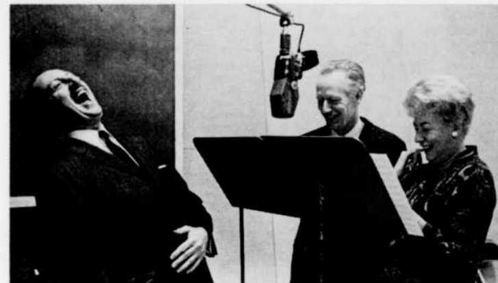
L'on s'amuse ferme à l'émission "Les Joyeux Troubadours", du lundi au vendredi à 11 h. 30 le matin.