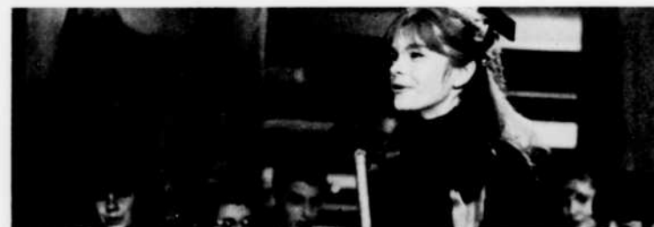
Geneviève Bujold anime l'émission du mardi de "Jeunesse oblige", à 6 heures.