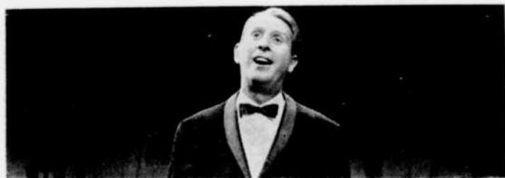
Charles Trenet à "Ils parlent et chantent", samedi à 7 h. 30, à la radio.