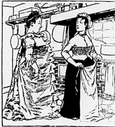
- Augmenter vos gages? Mais vous savez à peine faire la cuisine et tenir une maison. - C'est justement pour ça, madame. Comme je n'ai pas encore l'habitude, je me donne beaucoup plus de mal qu'une autre!

A 8 heures tous les artistes étaient prêts à monter en scène lorsque l'on s'aperçut qu'il manquait "la belle