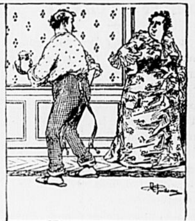
- Après avoir pris la dot de ma fille sans apporter un sou dans la maison, ça a l'air de d'apporter d'eau chaude tous les matins pour sa barbe!