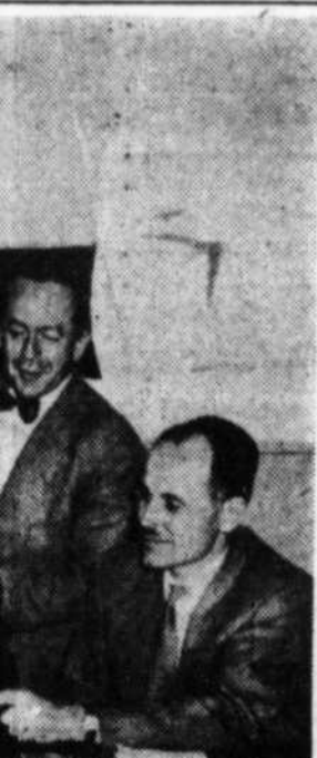
me dernière. De gauche gère (N.-Brunswick), nou- Paré (Québec); MM. les n (Québec).

du moins sommaire- es du Québec, n'ont e familiariser avec ce des autres provinces. ci un bref aperçu du çais tout entier, nous se fait en dehors du de la coopération du rochain, nous fournir plus de détails sur le propre province.