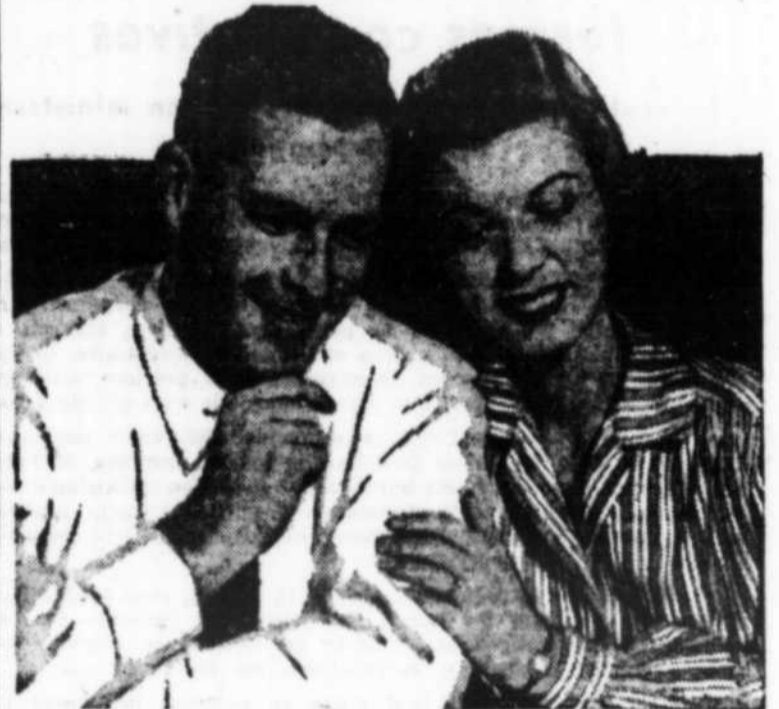
Qui aidera aux ménagères à se consacrer à l'essentiel de leur tâche de bâtisseuses de foyer et d'éducatrices?

"Même les tout-petits nous posent des problèmes. J'entendais l'autre jour à la radio qu'il peut être dangereux de gronder un en-