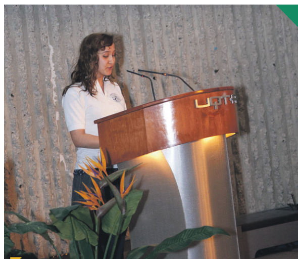
Conférence de presse pour le lancement des Entreprises Étudiantes 2011-2012

« Ce regain, on le doit au travail des membres du conseil d'administration. Ils sont jeunes, compétents et dynamiques. Ils croient aussi aux possibilités de ce programme et n'hésitent pas à mettre l'énergie nécessaire pour le faire grandir. »