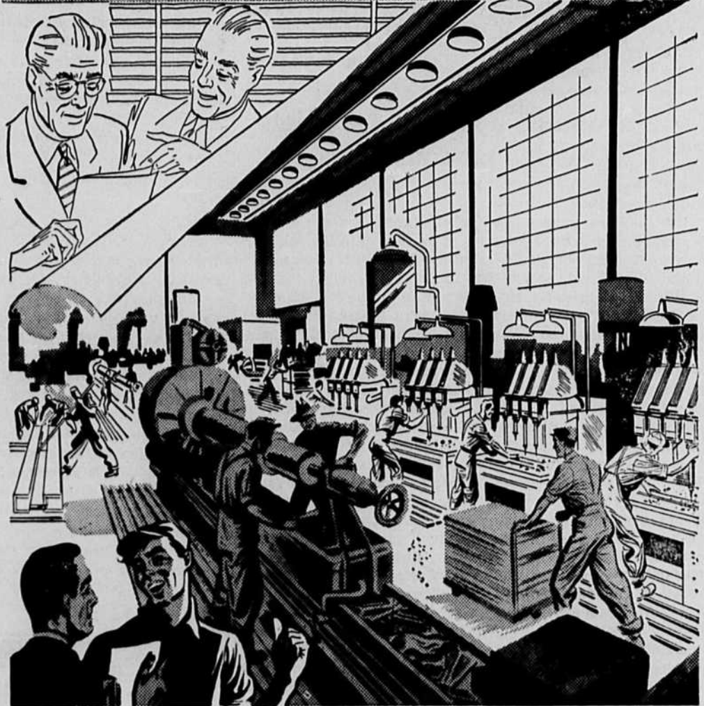
Hautes cheminées pointant vers le ciel, bâtiments de toutes sortes, cours de triage et voies d'évitement couvrant des acres et des acres, machines fébriles qui débitent des flots de marchandises, depuis les clous jusqu'aux automobiles. Telle apparaît l'industrie manufacturière canadienne, dont l'existence et le développement ont été assurés à chaque pas, grâce au concours de la Banque.

L'ASCENSION rapide du Canada au rang de nation industrielle de premier plan a été grandement facilitée par l'action de la banque. Depuis sa fondation en 1867, la Banque Canadienne de Commerce n'a cessé de jouer un rôle considérable dans la marche de ce magnifique développement.