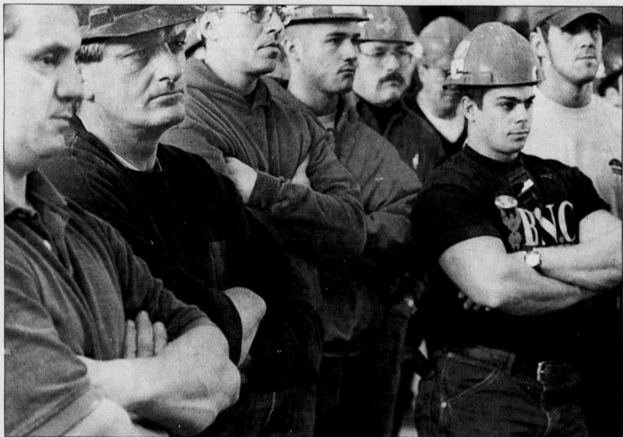
À Montréal, le chef bloquiste a rencontré des ouvriers sur le chantier de la Cité du multimédia. Le chef bloquiste s'est ensuite rendu à Québec.

En bon parti populiste, l'Alliance offre le plan le plus controversé