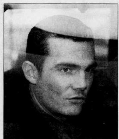
Richard Virenque à son arrivée au tribunal de Lille hier.