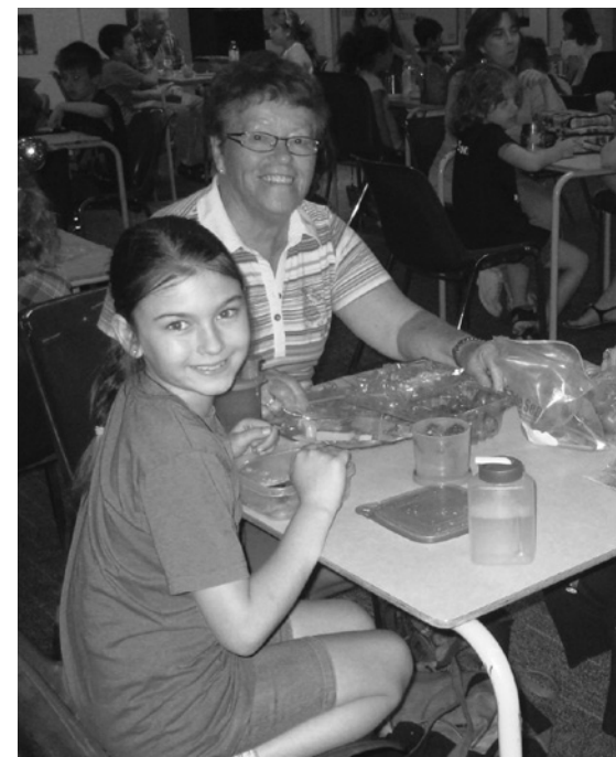
Dîner dans le cadre de l'activité Entr'Amis