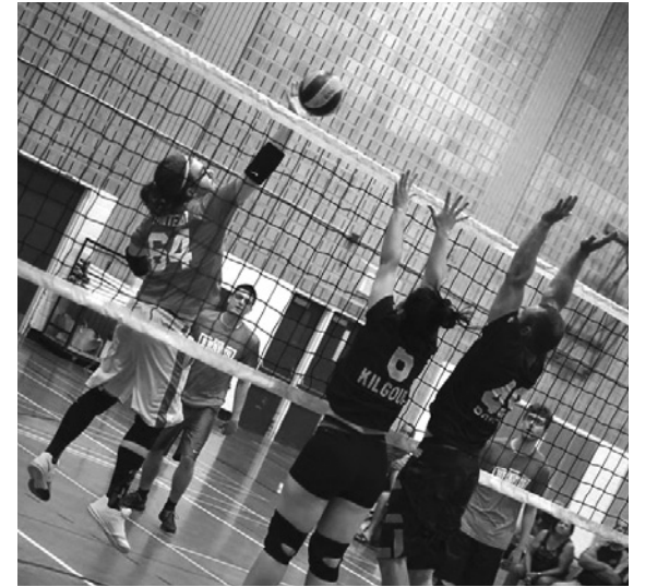
L'Omnium de volleyball

Nos équipes sportives ont su nous rendre fières en 2016