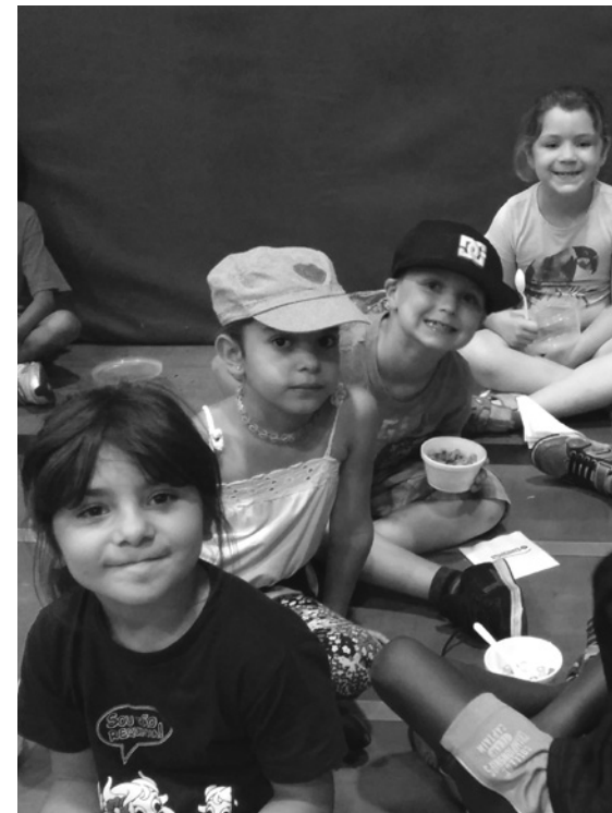
Les enfants du camp estival lors de L'Heureux déjeuner de l'été

L'édition 2016 du camp a attiré en moyenne 260 enfants tout au long des neuf semaines de l'été.