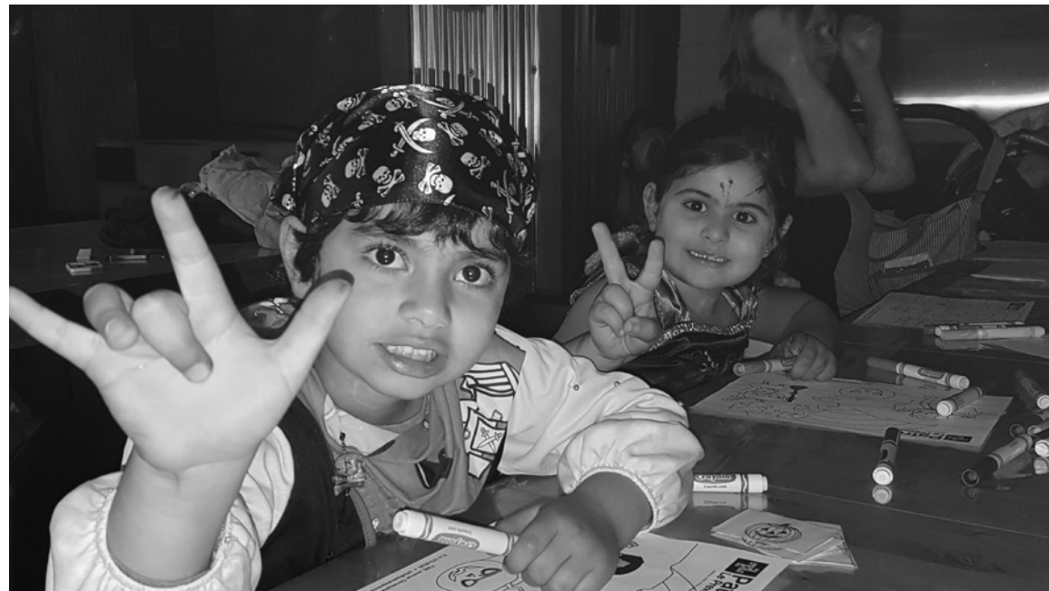
Activité de coloriage lors de la fête d'Halloween