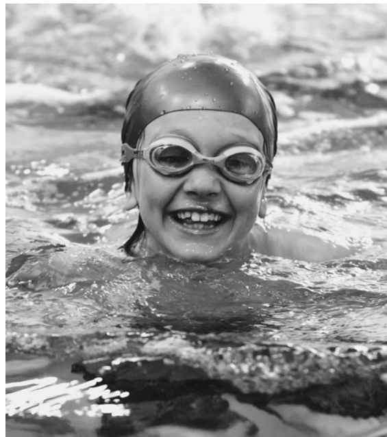
Petite fille heureuse dans la nouvelle piscine du Patro

Par session, de 40 à 70 membres se sont inscrits à ce forfait depuis sa création.