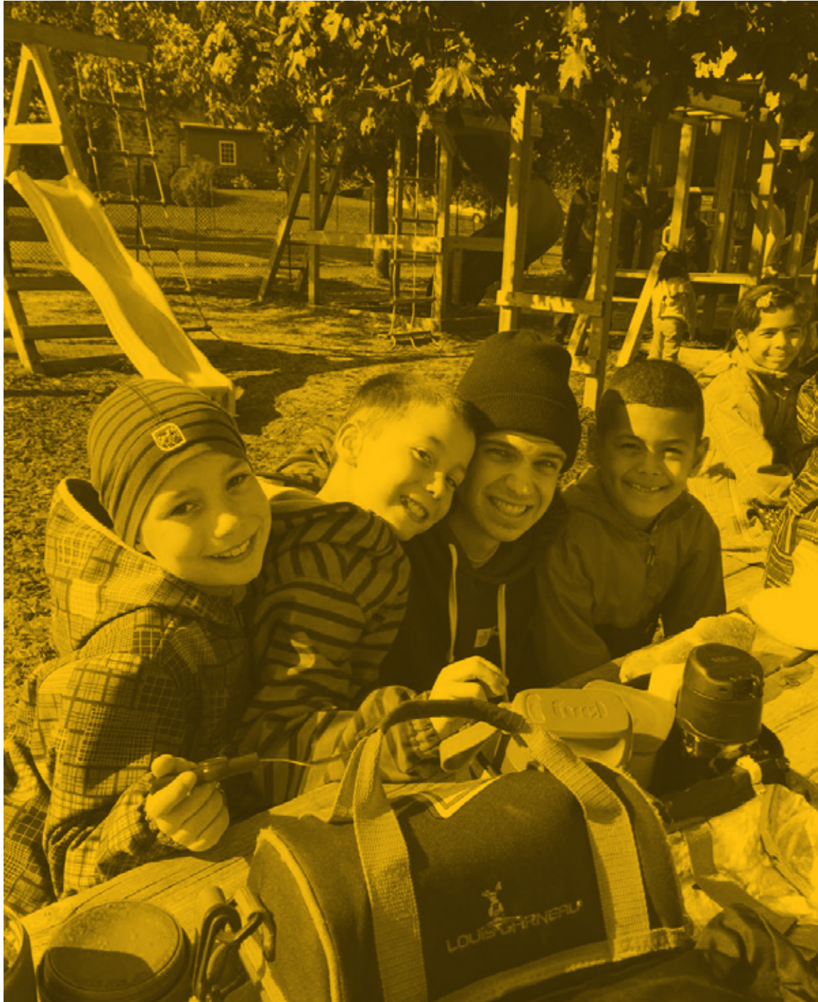
Sortie aux pommes avec le groupe des Samedis jeunes