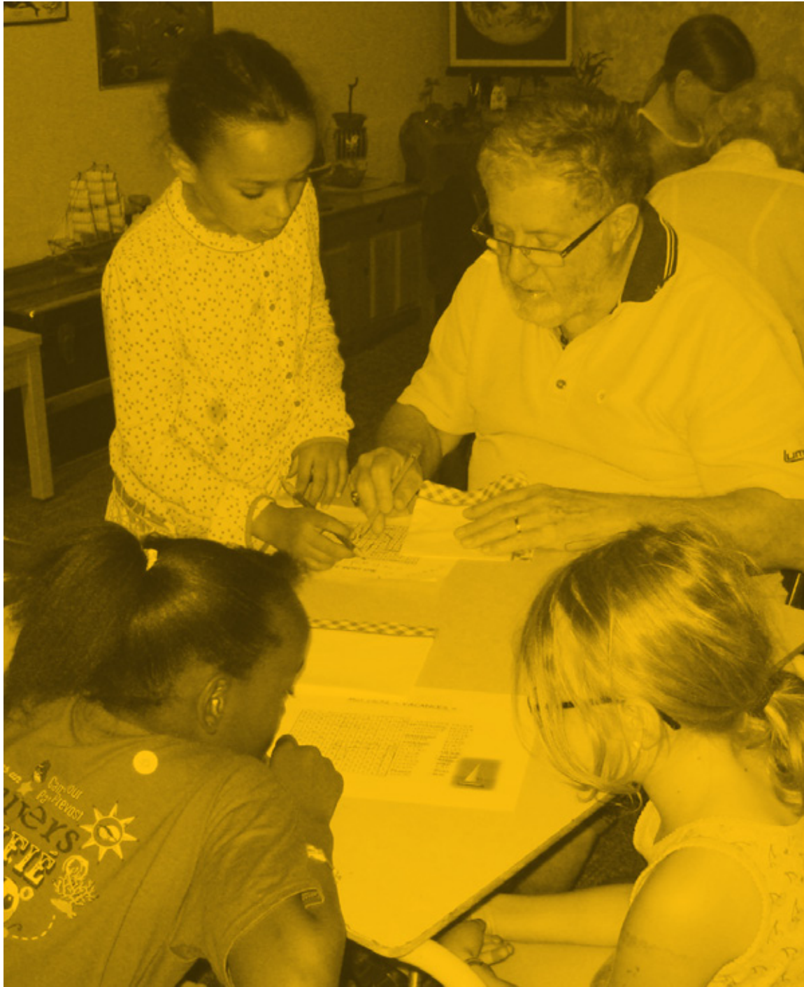
Jeunes et moins jeunes lors de l'activité Entr'Amis