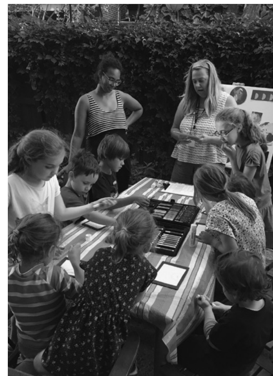
Les mardis d'ateliers

En 2016, de 30 à 50 jeunes se sont présentés chaque semaine à L'Espaç'Ados.