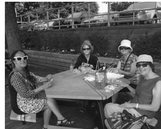
Sortie communautaire à la marina de Saint-Anne-de-Bellevue