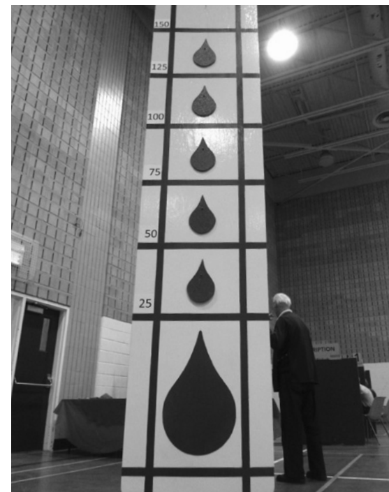
Collecte de sang