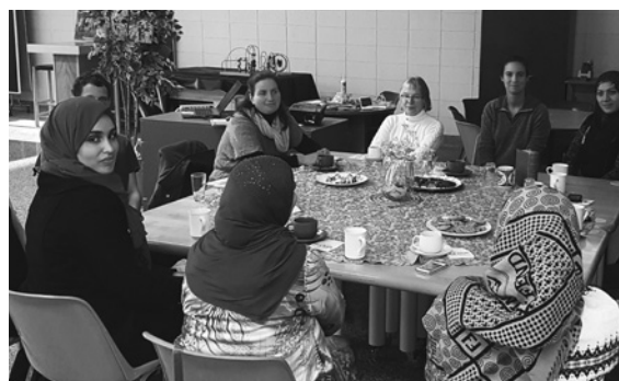
Participants à L'Interculturel café