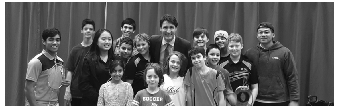
Visite du premier ministre Justin Trudeau au Patro

Nos équipes sportives ont su nous rendre fières en 2016