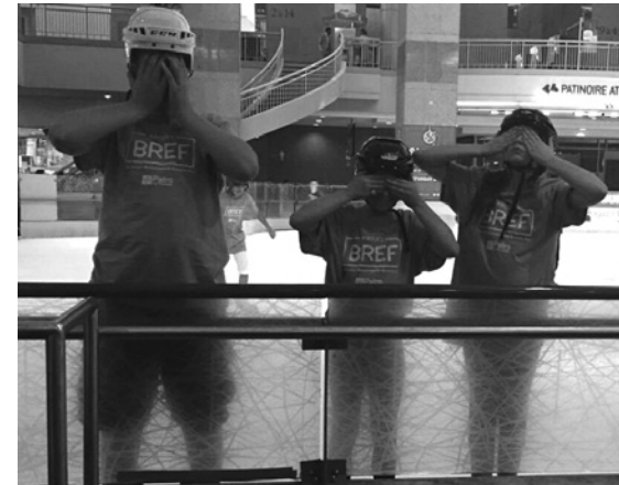
Adolescents du camp de jour