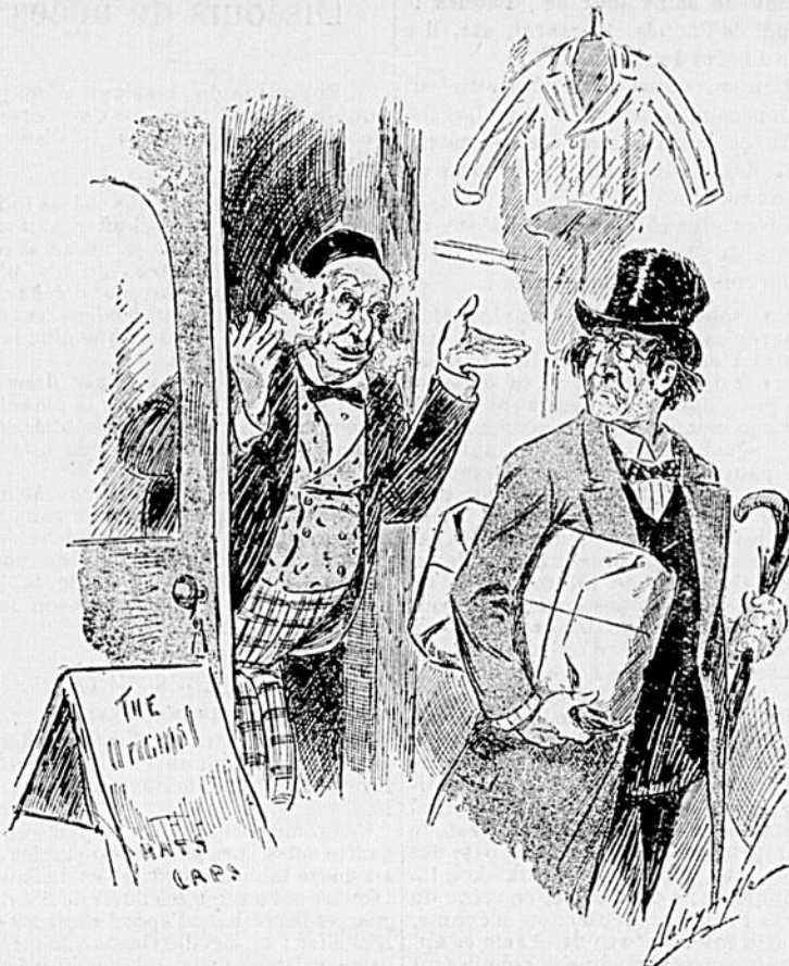
Je n'ai pas d'argent à vous prêter, votre sac n'est pas assez gros.

— Dam ! A quarante-neuf ans, c'est difficile.