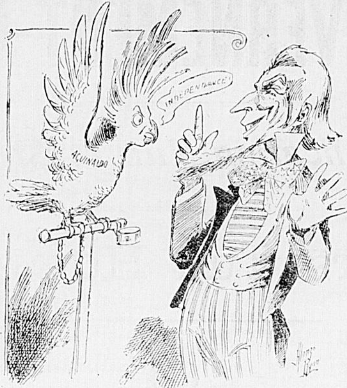
UNCLE SAM.—Maintenant, que j'ai pris cet oiseau, je vais lui apprendre à prononcer le mot "loyauté" au lieu de "indépendance."

Le BAUME RHUMAL calme les irritations des voies respiratoires.