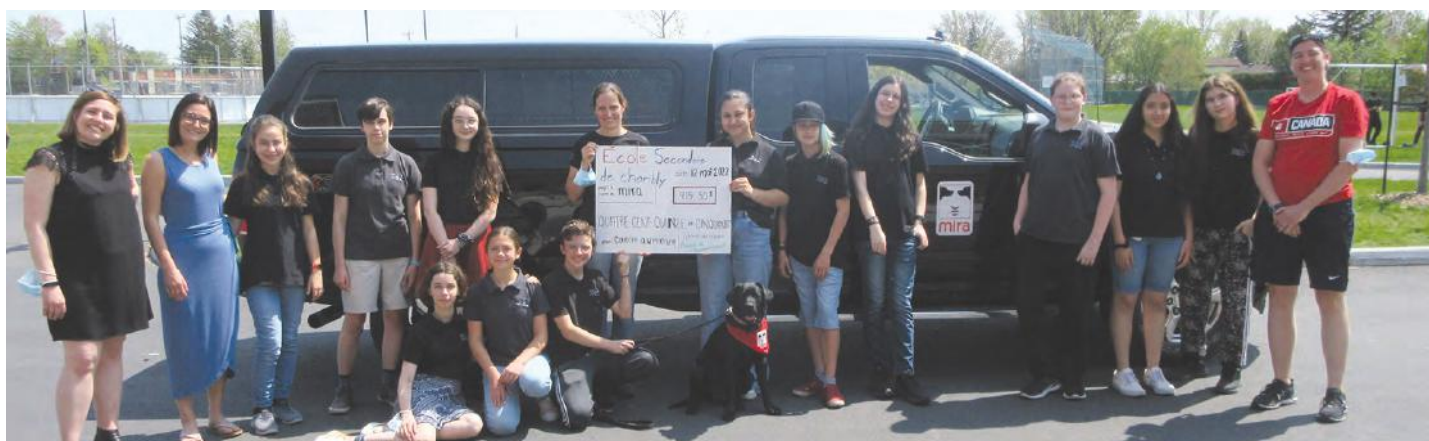
Les élèves de la Brigade environnementale rencontrent les chiens MIRA.

Un texte de Chloé-Anne Touma Initiative de journalisme local catouma@journaldechambly.com