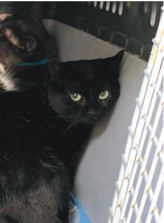
de Mont-Saint-Hilaire.

La SPCA Montérégie a un réseau de familles d'accueil très développé, ce qui lui permet, lorsque la capacité du centre est à son maximum, d'héberger les animaux un peu partout. Avec le boum de natalité des chats ce printemps « en très