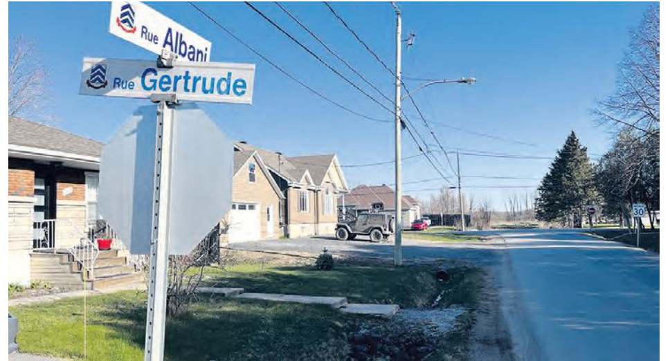
Les rues Albani et Gertrude, près des chantiers du secteur Centre de Carignan.

En plus de cette sensibilisation auprès des parents, la Ville a augmenté la signalisation sur la rue Marie-Anne avec l'ajout de bollards (cônes flexibles sur