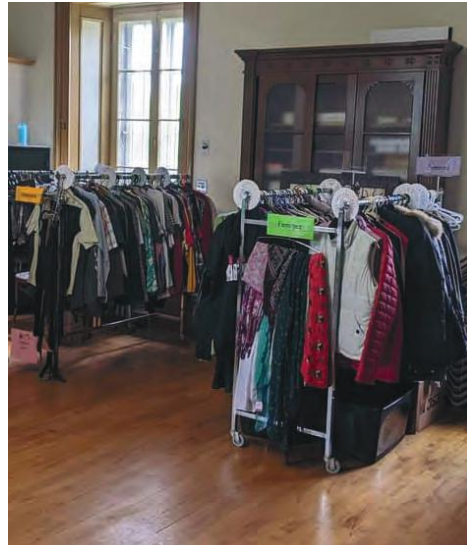
Linge déployé lors de l'ouverture des lieux.

Mis à part le linge, l'organisme amasse jouets, articles de cuisine, outils, etc. : tout pouvant aider, à l'exception de meubles volumineux. Pour recevoir les dons, un citoyen a construit bénévolement de ses mains une benne permettant de donner à toute heure. La friperie est ouverte les vendredis, de 14 h à 17 h, ainsi que les samedis, de 9 h à 12 h. Advenant des funérailles, l'espace sera fermé.