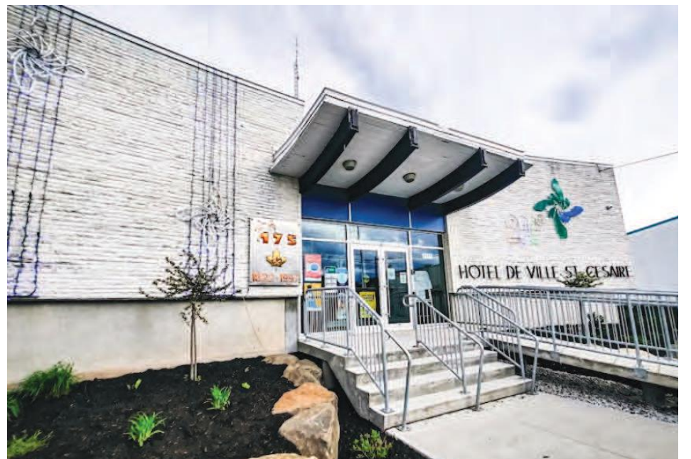
L'hôtel de ville de Saint-Césaire.

L'objectif de cette mission d'audit sera d'évaluer si la Municipalité est adéqua-