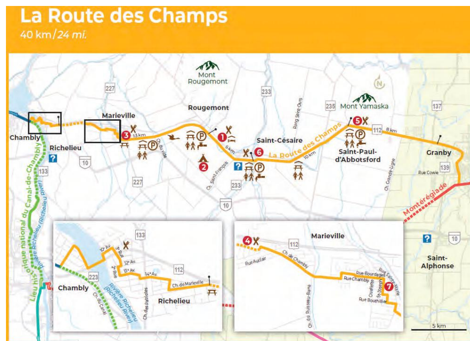
La carte de la Route des champs.

Circulez-vous sur La Route des Champs cet été? journaldechambly.com