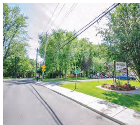
La Route des Champs de Tourisme au Cœur de la Montérégie.

« Une cohabitation efficace et respectueuse y est d'une importance primordiale. » - MRC de Rouville