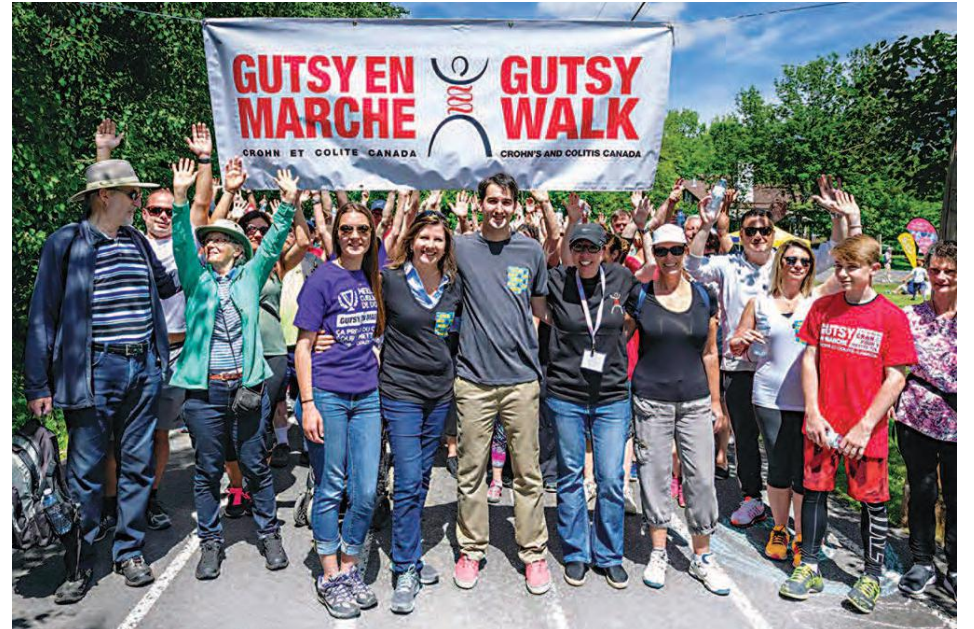
La marche Gutsy pour lutter contre la maladie de Crohn et la colite ulcéreuse est de retour cette année.

La randonnée Gutsy en marche est le plus grand événement communautaire du Canada célébrant les personnes touchées par la maladie de Crohn et la colite ulcéreuse. « L'un des pays les plus touchés au monde est le Canada. La colite ulcéreuse ne touche que l'intestin, tandis que la maladie de Crohn peut affecter tout le tube digestif, de la lèvre jusqu'à l'anus. » Pas moins de 270 000 Canadiens souffrent de ces deux maladies, qui sont les deux formes les plus courantes de