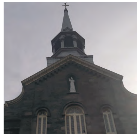
L'église de Sainte-Angèle-de-Monnoir.

« Les gens ont été généreux. » - Véronique Paré