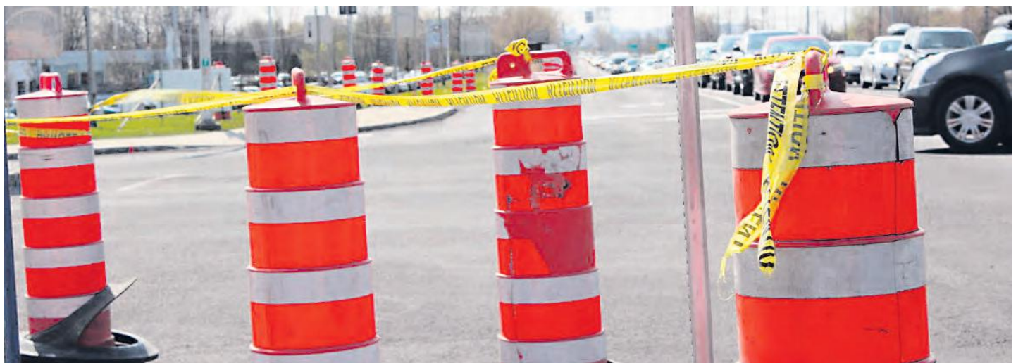
Les travaux d'asphaltage débutent bientôt sur l'A-10.

Jusqu'à la fin juin, l'asphaltage se déroulera sur la chaussée est, entraînant par défaut la fermeture de la bretelle d'accès