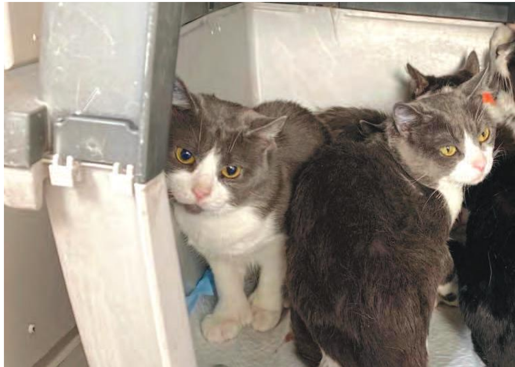
Ce sont 20 chats en une matinée qui ont été pris en charge gratuitement par la clinique vétérinaire Animalia

Réduire le nombre d'animaux errants et la surpopulation a toujours été une priorité pour la SPCA Montérégie, le premier refuge au Québec à stériliser tous ses animaux avant de les faire adopter. Rappelons que l'organisme est entièrement financé par les dons de la communauté.