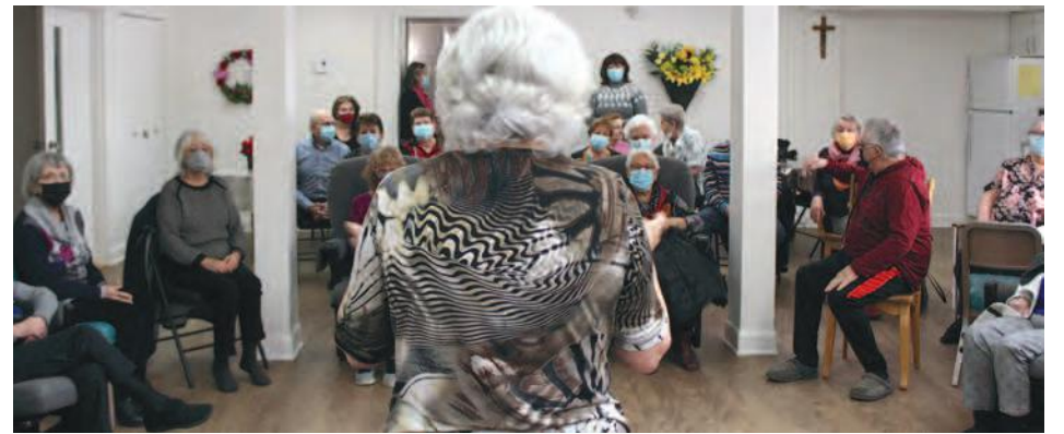
Il est trop tard pour la Villa Belle Rivière de redevenir une OSBL d'habitation.

« La FROHME s'est largement impliquée dans la foulée des ventes scandaleuses de la Villa Belle-Rivière de Richelieu et du Faubourg Mena'Sen de Sherbrooke.