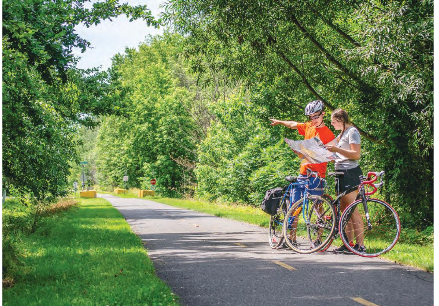
La Route des Champs de Tourisme au Cœur de la Montérégie.

« Une belle saison estivale s'amorce et j'invite les visiteurs, mais aussi les citoyens de la MRC de Rouville à venir découvrir ou redécouvrir notre région. Les producteurs et les commerçants