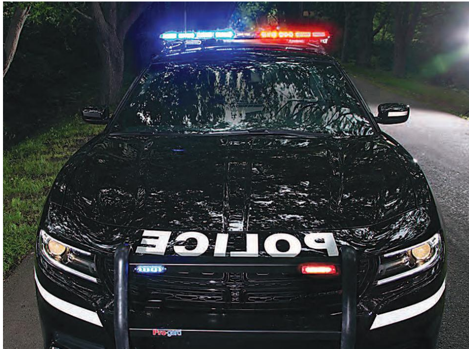
La SQ rapporte une hausse de vols de catalyseurs sur le territoire.

La Ville de Marieville affirme avoir constaté une hausse des actes de vandalisme sur son territoire, rapportant des dommages quant aux abribus et au mobilier urbain. Dans un effort de sensibilisation, elle a rappelé que « Le vandalisme n'est pas un geste banal, puisque briser ou abîmer volontairement ce qui appartient à une autre personne, ou ce qui se trouve dans l'espace public, constitue une infraction criminelle que l'on appelle un méfait. Endommager un abribus, faire un graffiti sur un mur ou briser du mobilier urbain sont des exemples de méfaits. Le vandalisme engendre des coûts et des désagréments importants pour toute la collectivité. Pour qu'un milieu de vie soit agréable et vivant, il importe que les gens s'y sentent en sécurité, et la multiplication des méfaits contribue au sentiment d'insécurité. »