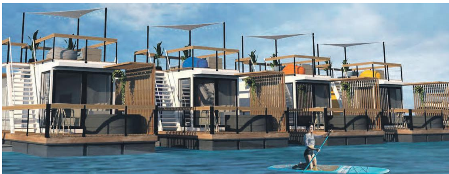
Un aperçu de ce dont aura l'air le parc Eau Villa.

Que pensez-vous de l'annonce de cette nouvelle offre à Chambly? journaldechambly.com