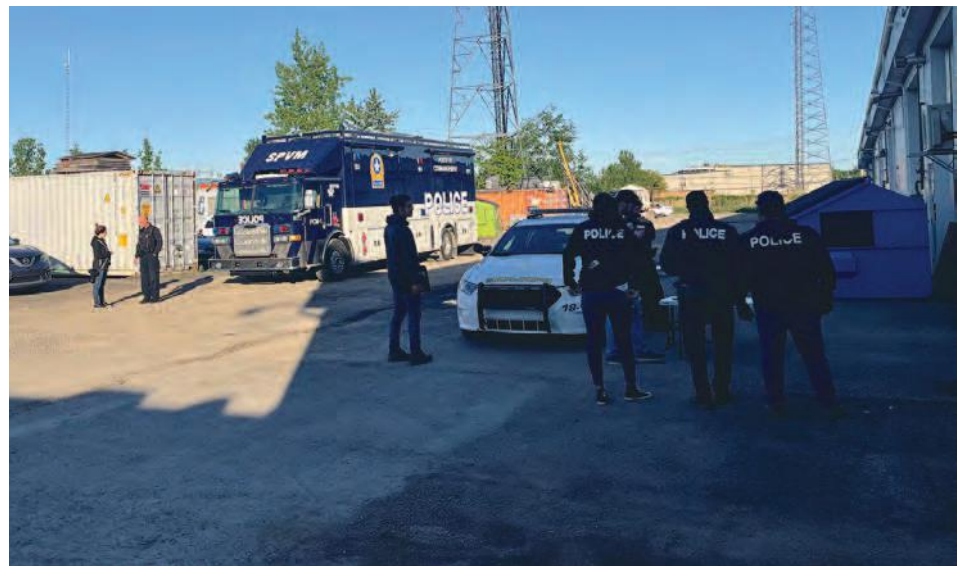
Les policiers en pleine saisie dans le parc industriel de Chambly.