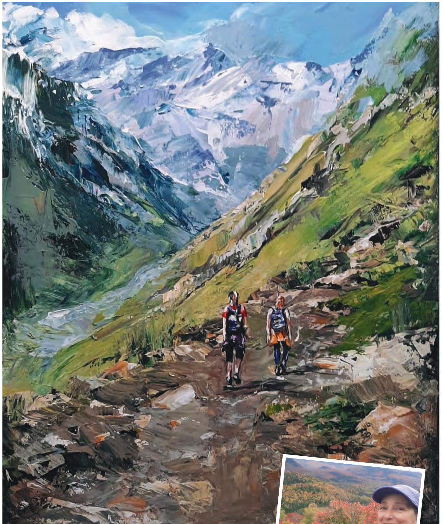
Une exposition de Manon Marchand présentant des paysages montagneux vous attend à Chambly.

« Dans la vie, il y a des creux, des montées, et on se ressource en bas. Lorsque l'on monte, on voit ce que l'on a gravi, mais aussi qu'il y a toujours des sommets plus hauts à atteindre. C'est ça, la beauté de la vie, et je pense que ça résonne auprès du public. Les gens s'y reconnaissent, et pas seulement en tant que randonneurs. Ils retrouvent en mon