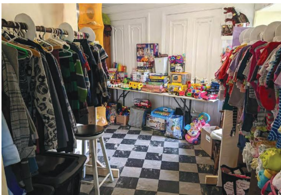
Des jouets sont aussi reçus à la friperie.