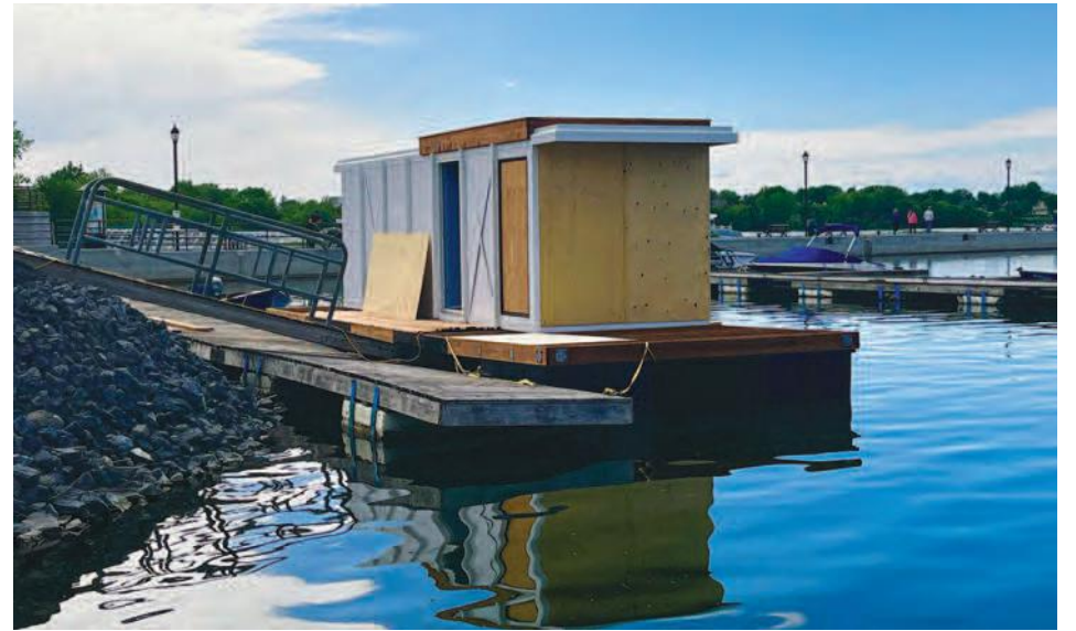
La première minimaison flottante installée.