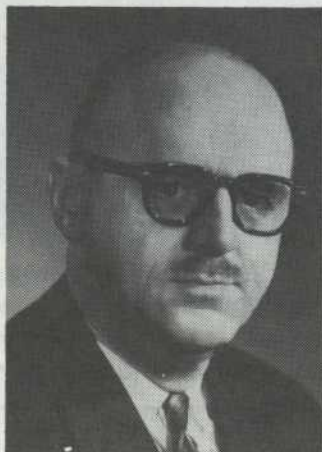
Son Honneur le Maire de Montréal M. Jean Drapeau, c.r.