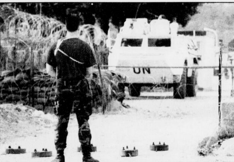
Un soldat musulman garde une des voies d'accès à la base des casques bleus canadiens à Visoko, en Bosnie.

Si la nouvelle approche semble indiquer que le régime cubain entend ainsi sauver le système de parti unique, les diplomates étrangers estiment que c'est une aussi une réponse au mécontentement croissant de la population qui souffre de pénuries de nourriture, d'essence, de médicaments et de la détérioration des services en raison de la crise économique.