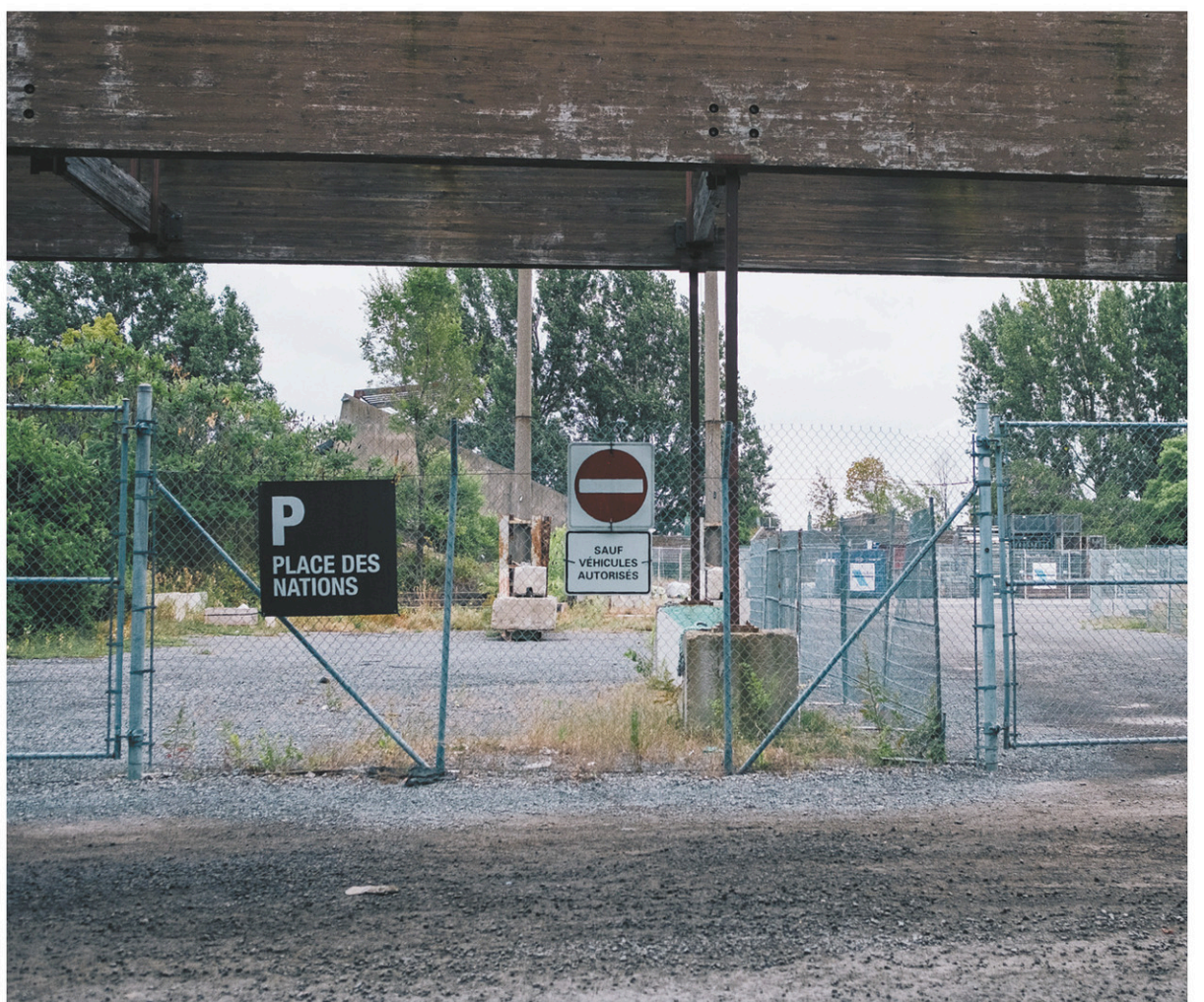
La Place des Nations est dans un état délabré et elle est barricadée à la suite d'effondrements.