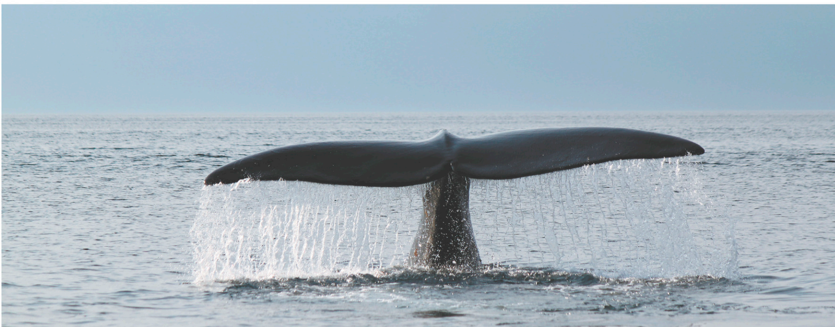
Les baleines noires ont tendance à nager souvent près de la surface, les rendant particulièrement vulnérables aux collisions avec les navires commerciaux.