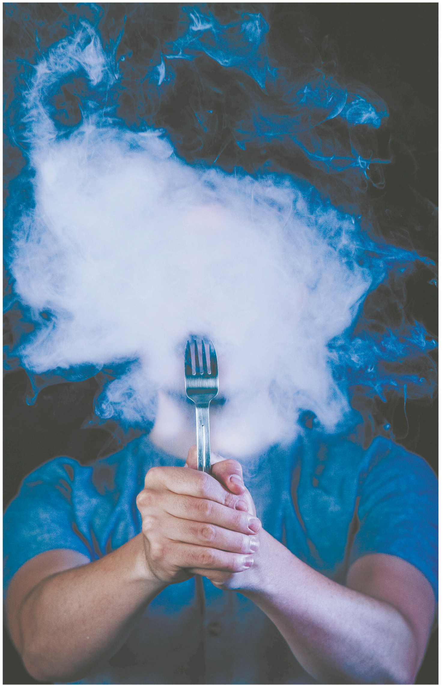
Que les amoureux de délices perdues soient rassurés : les résurrections sont fréquentes au cimetière des saveurs consacrées.

riz que l'on retrouve dans le commerce, connue en langue ojibwée sous le nom de manomin .