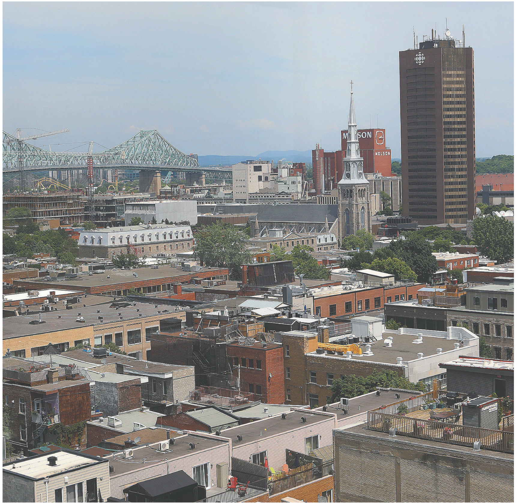
L'Office de consultation publique de Montréal propose de faire de la rue Sainte-Catherine Est le cœur des Faubourgs et d'y ajouter des promenades vertes. Il suggère également de connecter des réseaux d'espaces verts et d'étendre certaines artères.

Le rapport de l'OCPM donne également des orientations afin de rendre l'accès aux berges du fleuve Saint-Laurent plus facile et plus sécuritaire.