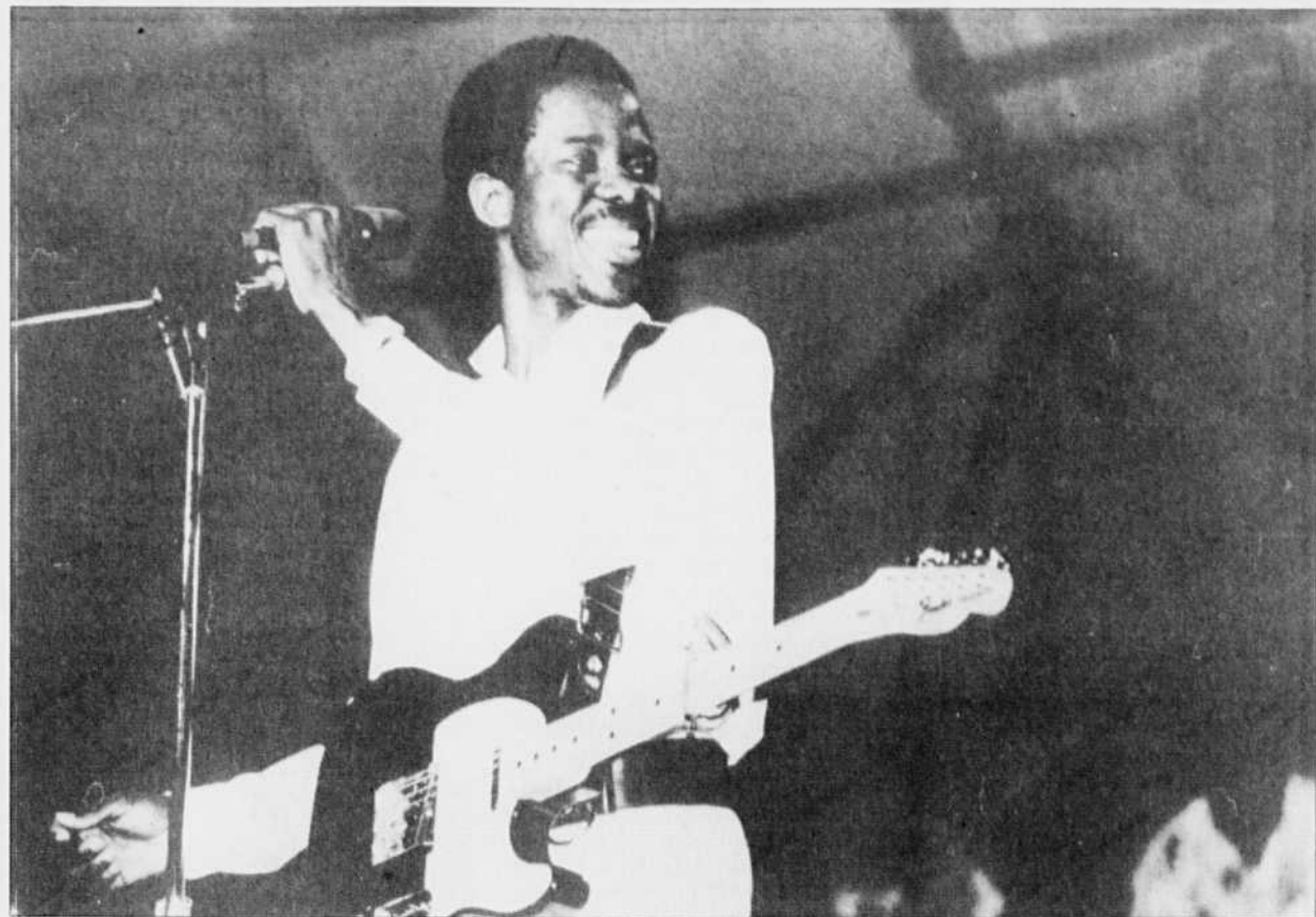
Le Nigérian King Sunny Adé et ses 22 musiciens-chanteurs reviennent en trombe au Spectrum mercredi soir prochain.

Alors que dans les années 70 la musique d'Afrique montrait timidement le bout du nez avec des artistes isolés (dont Manu Dibango et la chanteuse Myriam Makeba),