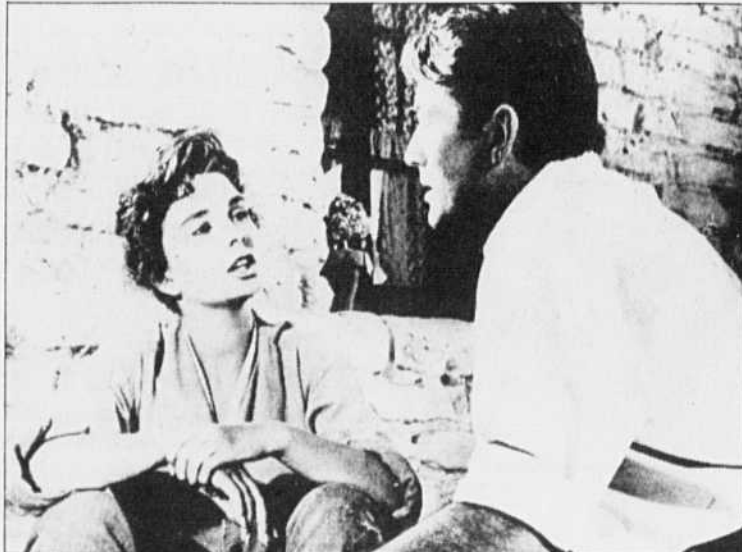
Jean Simmons et Gregory Peck dans une scène des Grands espaces ( The Big Country ).