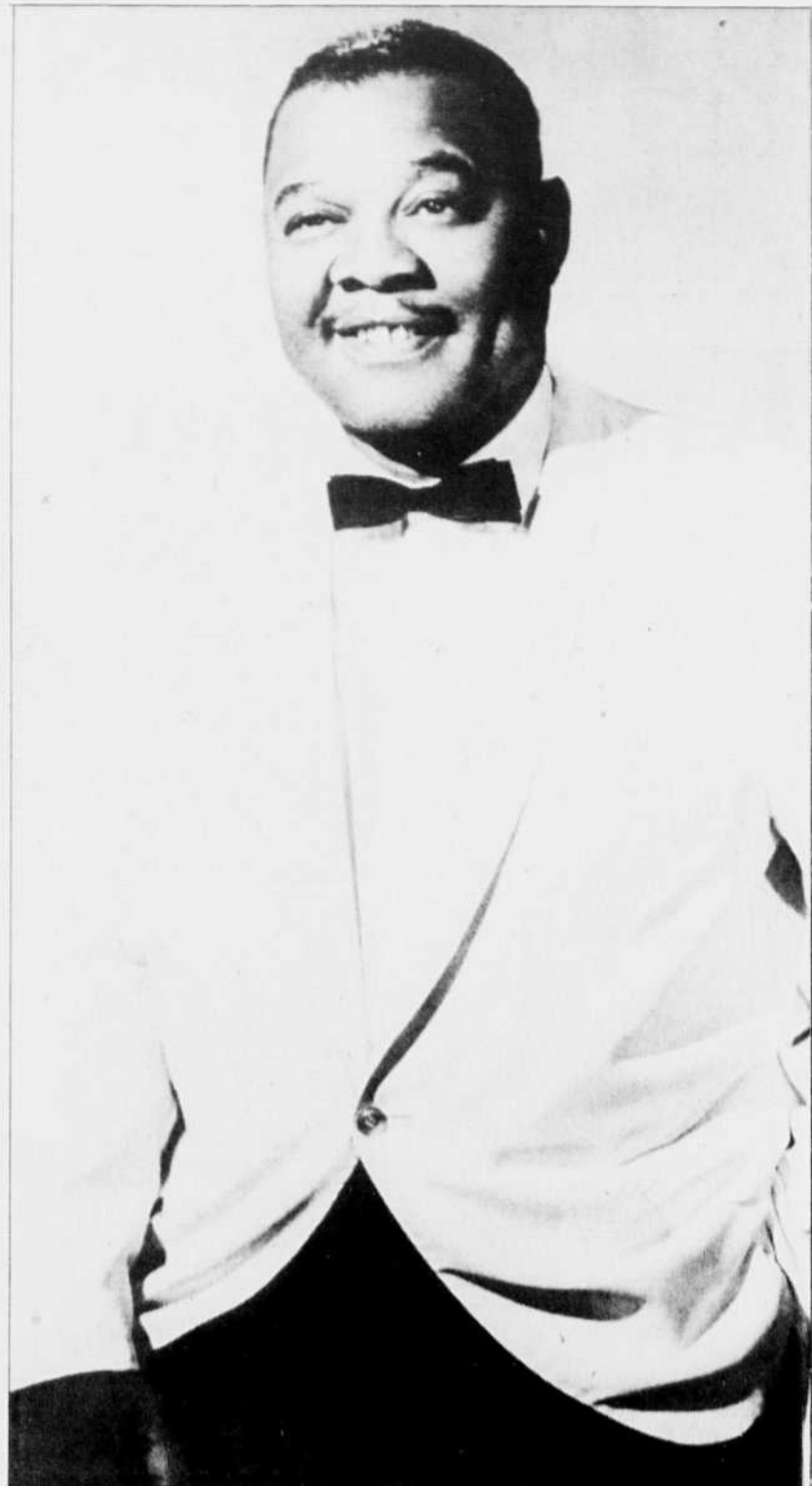
Jay McShann photographié en 1939 à l'époque où il dirigeait les Blues Devils.

Il n'en fallait justement pas moins pour que la compagnie Sackville de Toronto l'invite, après des années laborieuses, à enregistrer un album intitulé The Man From Muskogee pour qu'à nouveau on remarque le talent de Jay McShann. Depuis lors, cet artiste au style éminemment chaleureux n'a pas stoppé de nous livrer à intervalles trop éloignés les uns des autres d'égrener ses merveilleuses notes. Il faut qu'il reprenne à nouveau les rênes de son Air Mail Special .