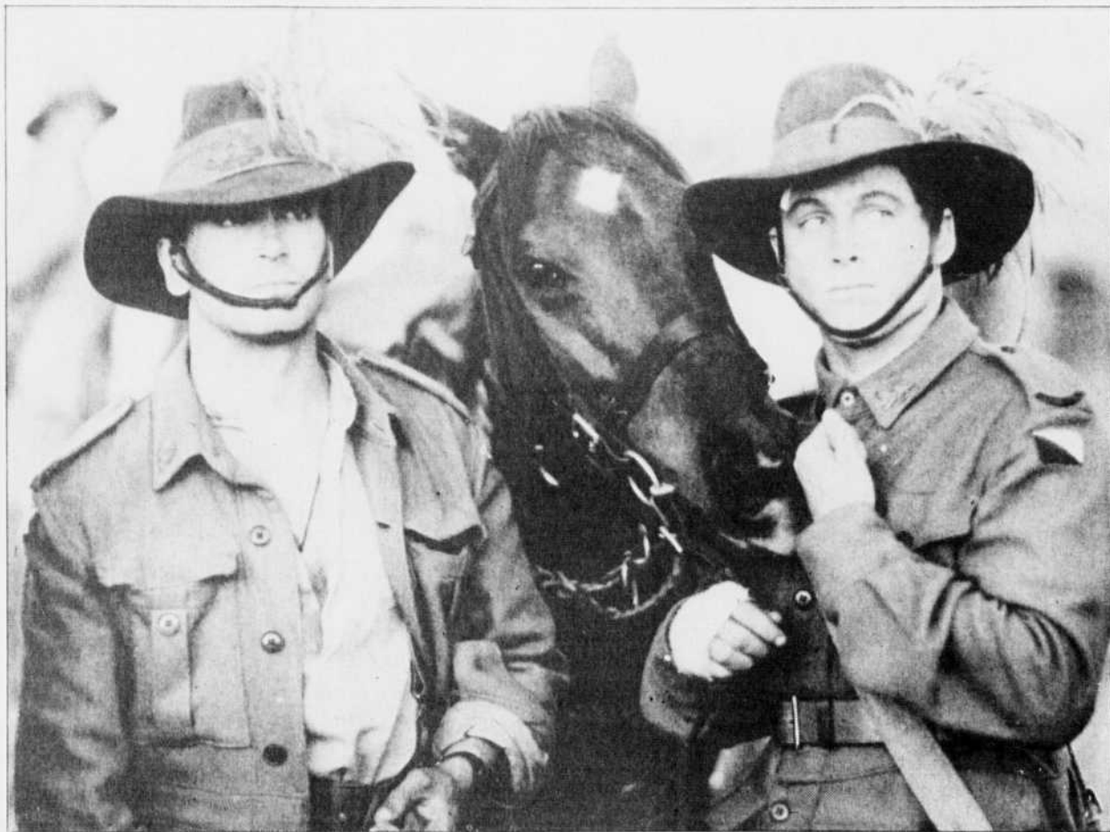
Une scène du film australien The Lighthorsemen du réalisateur Simon Wincer. Une fresque historique sur la guerre de Palestine en 1917.

Le film, immense fresque historique, est aussi épopée, celle des chevaux et des hommes. Alors, on ne lé-