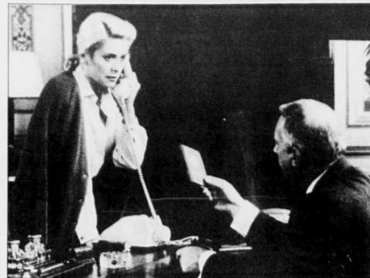
Le bon plaisir de Francis Girod avec Catherine Deneuve et Michel Serrault.