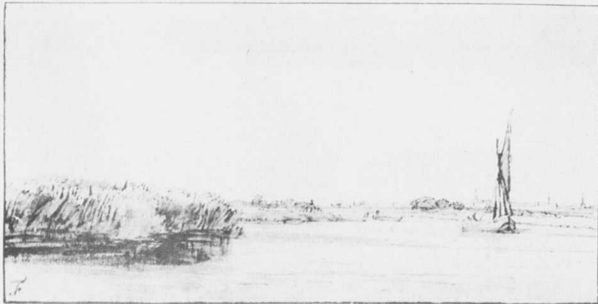
Rembrandt van Rijn, Bateau à voiles sur une large voie d'eau, The J. Paul Getty Museum, Malibu, Californie.