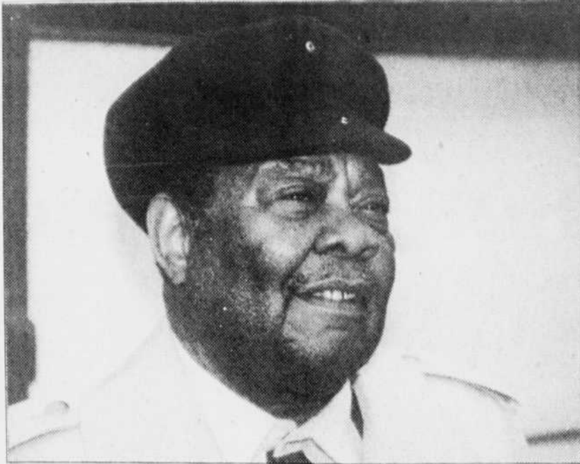
Jay McShann sur la pochette de Airmail Special enregistré à Toronto.