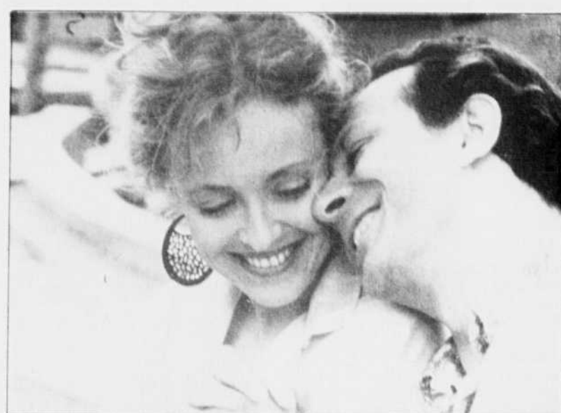
Tant qu'il y aura des femmes avec Fanny Cottençon et Roland Giraud. Un héros tombé bien bas.

son « ex », de son actuelle et de sa future (Marianne Basler), le personnage de Sam est joué sans conviction par un Roland Giraud dont le sempiternel étonnement naïf finit par lasser. Il n'est plus mou, il est veule.