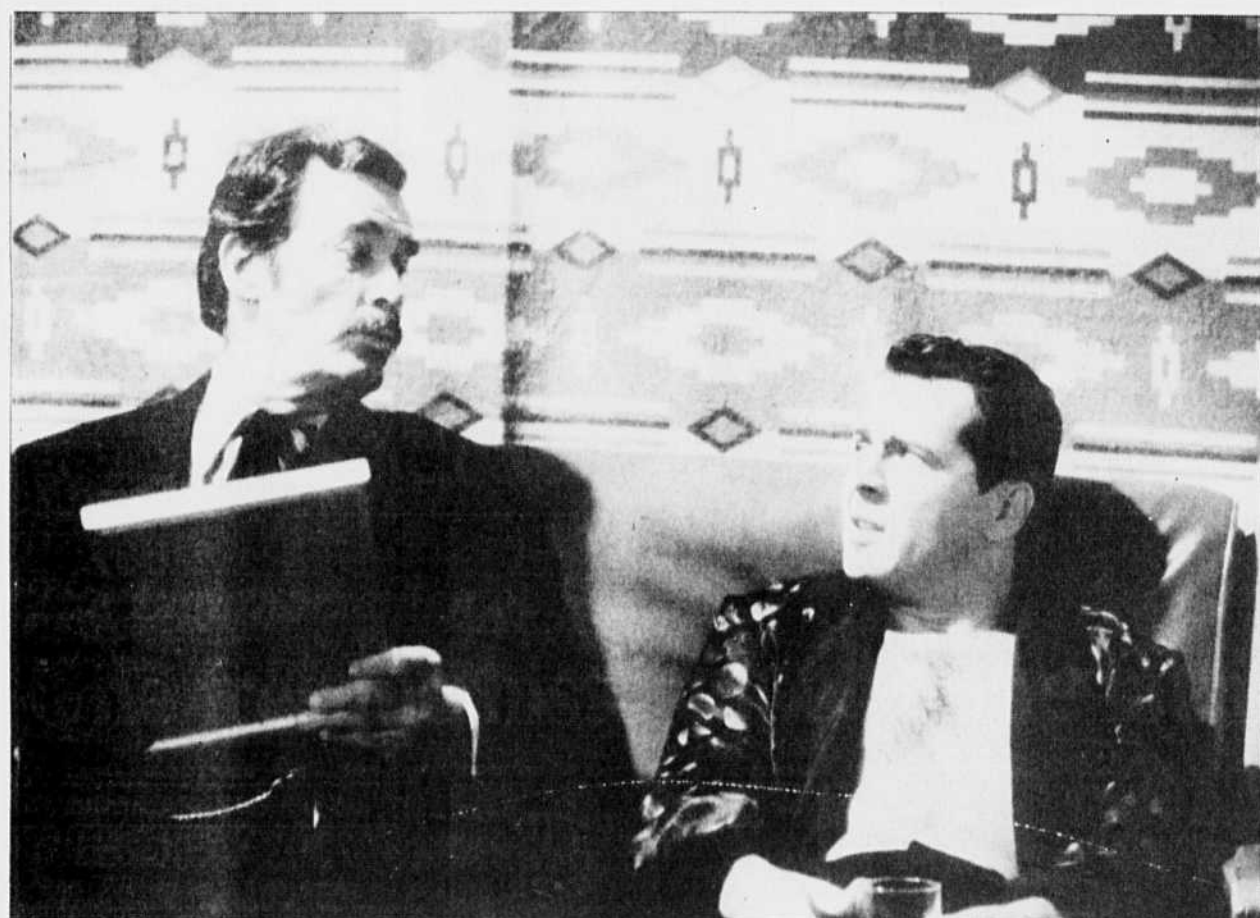
James Garner et Bruce Willis dans une scène de Sunset . L'oeuvre « crépusculaire » du réalisateur Blake Edwards.

Le film cherche à nous divertir tout simplement avec une intrigue policière d'une banalité affligeante et une mise en scène sans relief. Les comédiens, Bruce Willis, James Garner, Malcolm McDowell font de leur mieux mais quand le scénario est oiseux, on ne fait que de l'esbroufe. Sunset , c'est vraiment l'oeuvre crépusculaire d'un réalisateur.