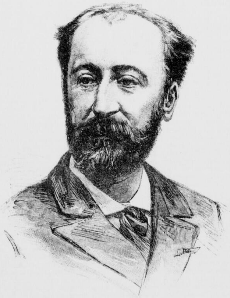
M. CAMILLE SAINT-SAENS, auteur de « Henri VIII ».