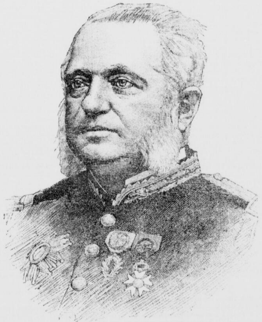
LE VICE-AMIRAL PEYRON