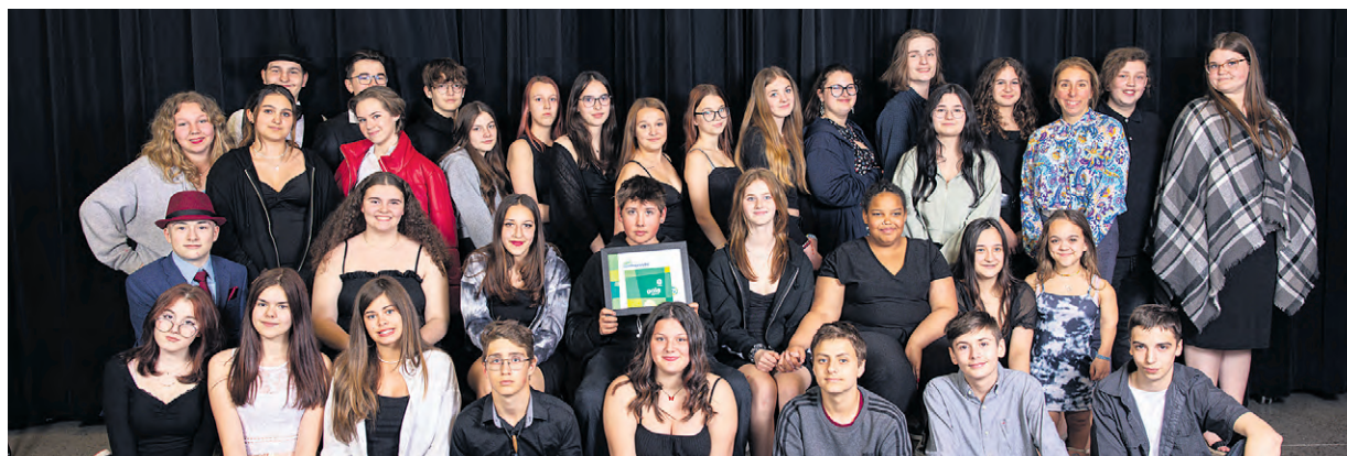
C crédit photo : Gracieuseté