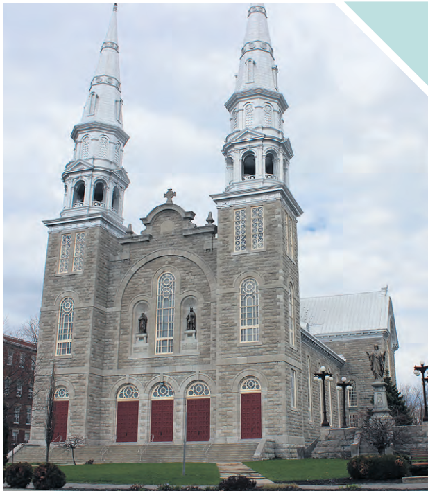
L'église de Saint-Jacques pourrait bien présenter une nouvelle vocation au cours des prochaines années.

Pour M me Forest, le parc Nature représente un beau trésor, « pour et par les citoyens, car à l'automne, nous les invitons à prendre part à une petite corvée de nettoyage ».