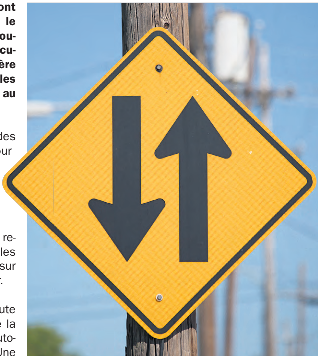
La circulation à contresens sur l'autoroute 25 Sud se poursuit.

Entretemps, la circulation à contresens sur l'autoroute 25 Sud se poursuit. Les usagers sont invités à suivre la signalisation en place à l'approche des bretelles de l'autoroute 25 afin de bien intégrer le couloir à contresens. Une diminution de la limite de vitesse à 70 km/h demeure en vigueur. (MCG)