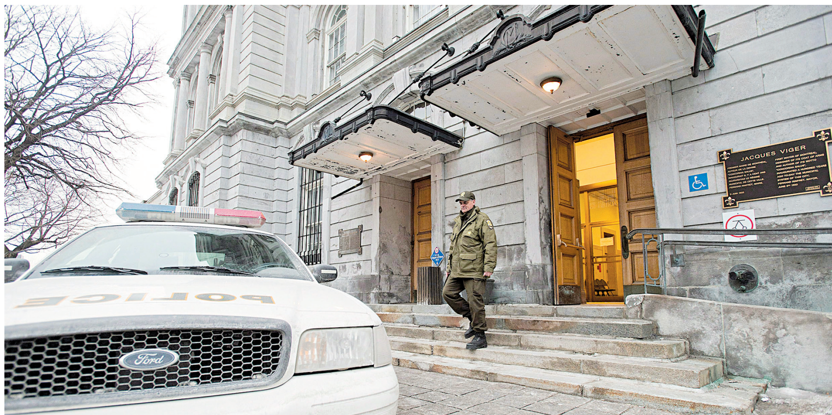
Les scandales qui ont secoué l'Hôtel de Ville ont amené les élus à mettre en place une administration de coalition.

Un règlement d'emprunt de 170 millions a été adopté par le conseil municipal permettant