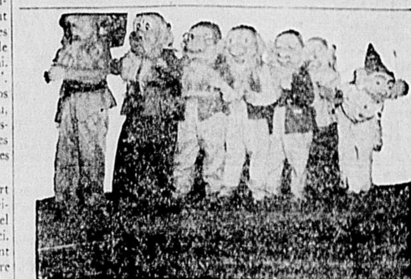
Pour la première fois, un même film est donné à Montréal en français et en anglais en même temps. Tandis que "Blanche-Neige" passera à l'Orpheum, on pourra voir "Snow White" au Prince.