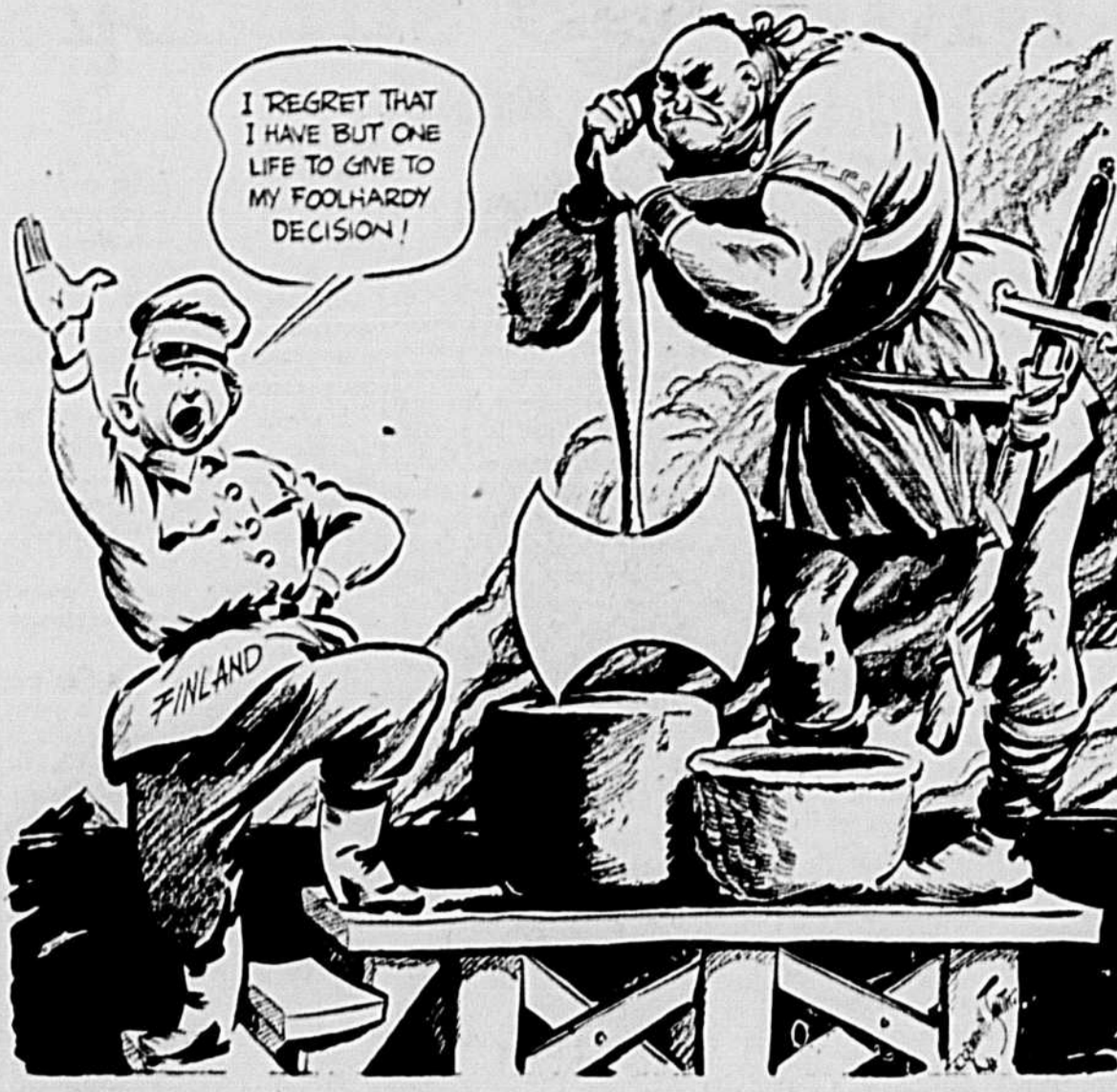
Conversation de Table