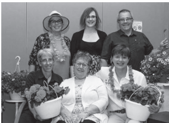
Le Comité d'embellissement de Compton prenait aussi part à l'organisation de la soirée.