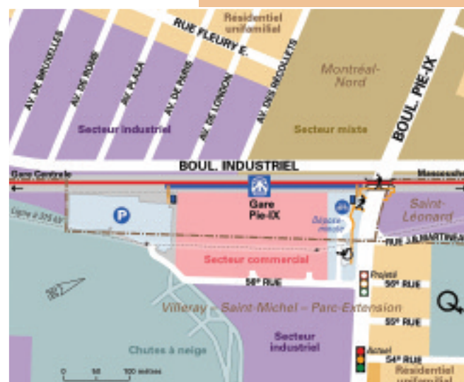
Plan préliminaire de la future gare Pie-IX.