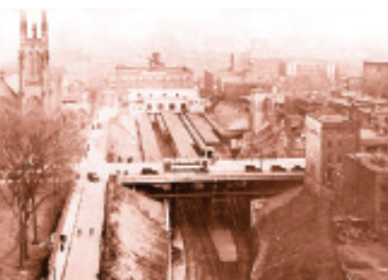
Vue de la gare du tunnel.