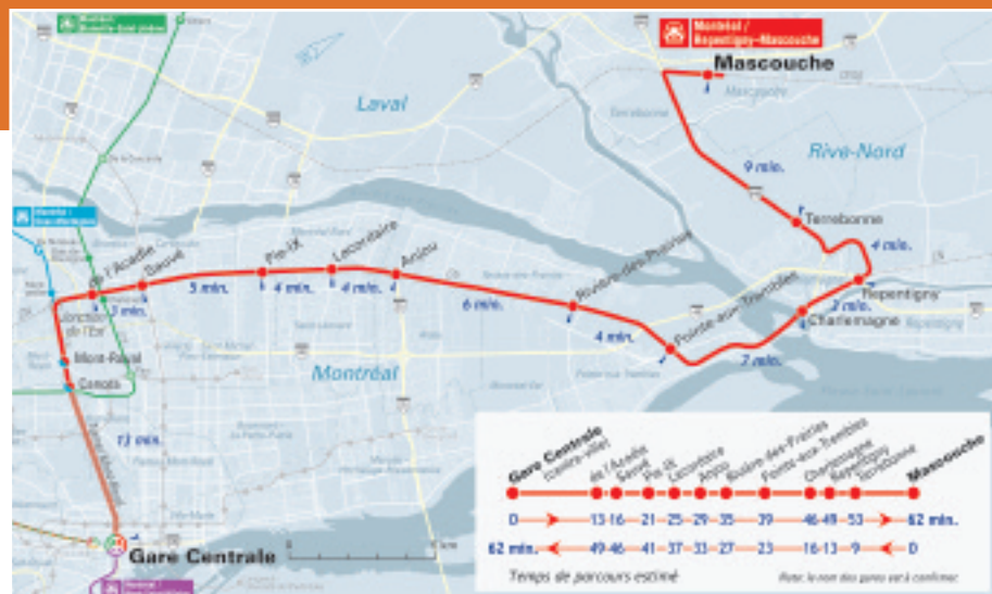
Tracé projeté du futur train de l'Est.