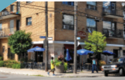
Commerce de la rue de Charleroi.