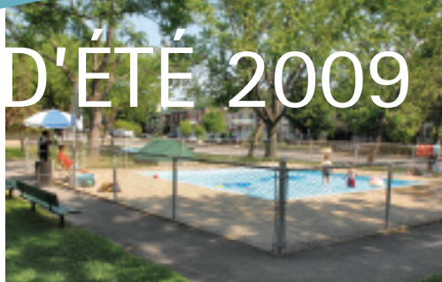
Sauveteuses – Pataugeoire.