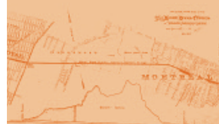
Tracé du tunnel sous la montagne.