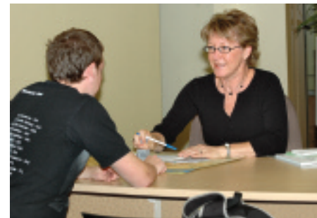
Le bureau d'accueil aux citoyens, 4243, rue de Charlevoix.