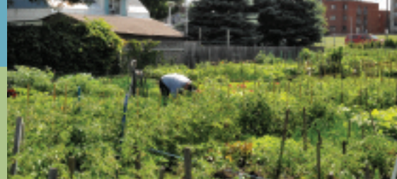
Coordonnateur du jardin communautaire.

Travailler à la préparation et à l'attribution des jardinets et superviser le déroulement de l'activité tout au long de la saison. Contribuer, par ses conseils aux usagers, au succès de la récolte. Voir à l'approvisionnement en matériel requis. Participer à l'organisation des fêtes de clôture. Fournir un rapport détaillé à ses supérieurs à la fin de la saison.