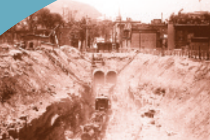
Construction du tunnel sous le mont Royal.