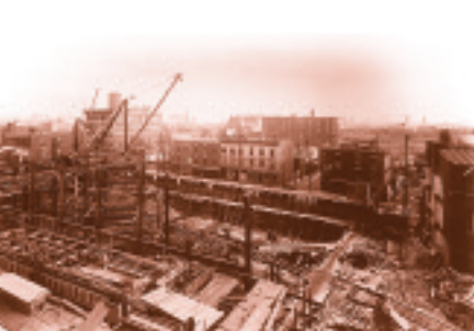
Construction de la gare Windsor, en 1887.