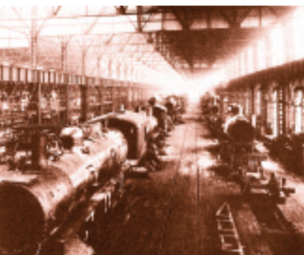
Les ateliers Angus, en 1915.