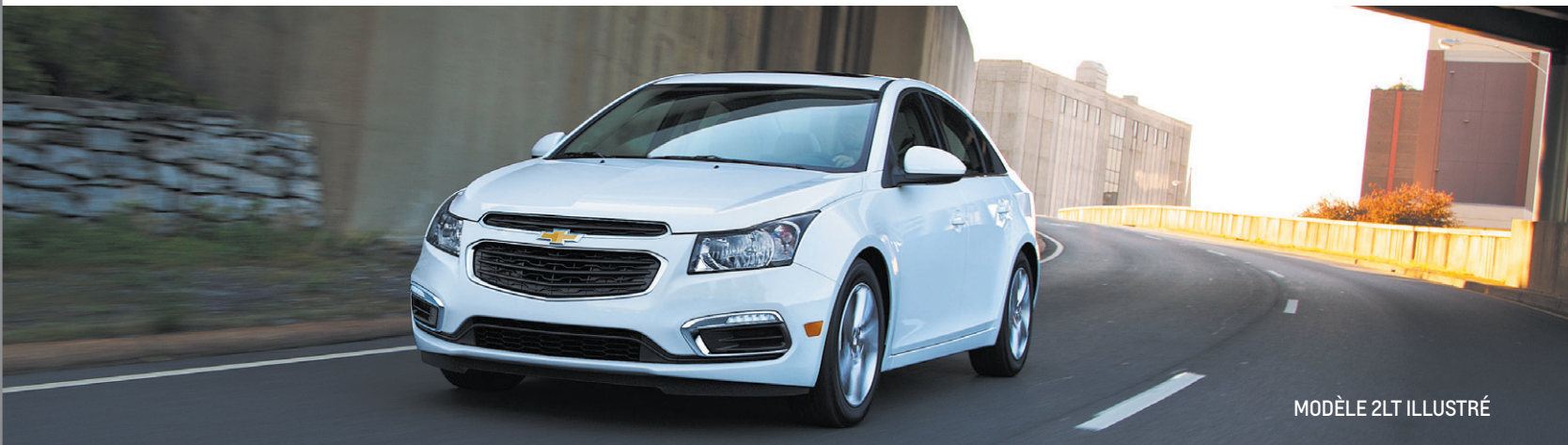
MODÈLE 2LT ILLUSTRÉ

DU JAMAIS VU: LOUEZ LA CRUZE À PARTIR DE 29$ PAR SEMAINE!