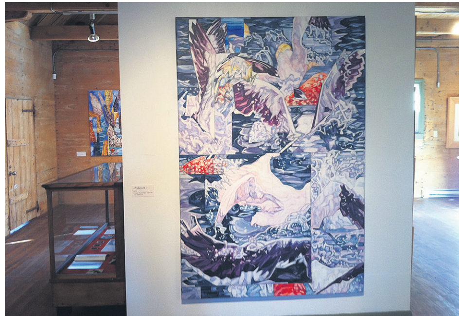
Une œuvre de Thierry Pertuisot

À la mezzanine, l'exposition intitulée « Percée de lumière » présente une série d'une vingtaine d'œuvres d'Hélène Normand, une artiste de Sainte-Félicité (Bas-Saint-Laurent). Sa technique à la spatule est maîtrisée. Les œuvres exposées mettent en scène des barques et autres goélettes sur une mer parfois agitée parfois tranquille enveloppée d'un brouillard qui renvoie à une intimité singulière. Le choix du Havre. À voir, absolument.