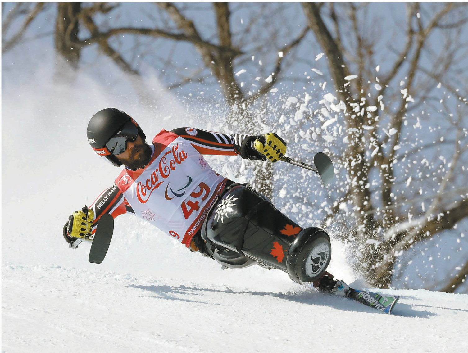
LEE JIN-MAN ASSOCIATED PRESS

Kurt Oatway, de Calgary, a terminé sur la plus haute marche du podium en super-G en position assise.