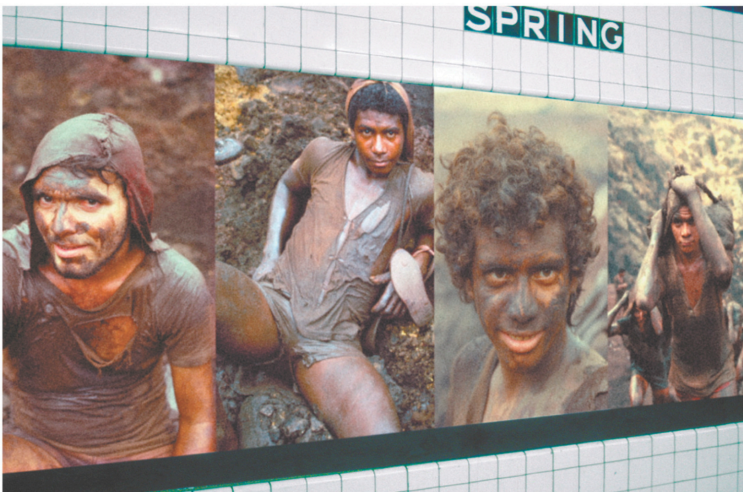
FESTIVAL DU FILM SUR L'ART

Alfredo Jaar a réalisé un art plastiquement fort qui éveille les consciences autour de sujets politiques comme le coup d'État de 1973 au Chili, pays où il est né, ou le génocide au Rwanda.