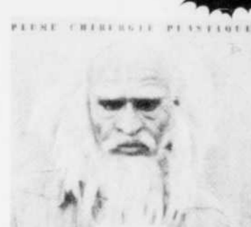
PLUME Chirurgie plastique Rég. $8.98 SPECIAL 7 18