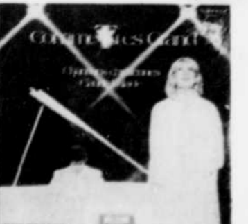
CLAUDE VALADE Comme tu es grand Chansons chrétiennes Rég. $8.98 SPECIAL 7 18