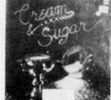
CREAM & SUGAR Rég. $8.98 SPECIAL 7 18