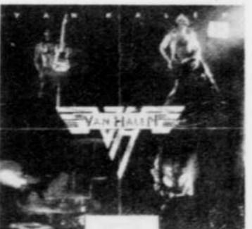
VAN HALEN Rég. $7.98 SPECIAL 6 39