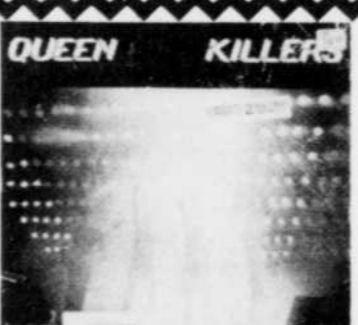
QUEEN KILLERS Live Rég. $14.98 SPECIAL 11 99