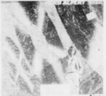
HERB ALPERT Rise Rég. $8.98 SPECIAL 7 18