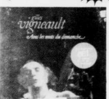
GILLES VIGNEAULT Avec les mots du dimanche Rég. $12.98 SPECIAL 10 49