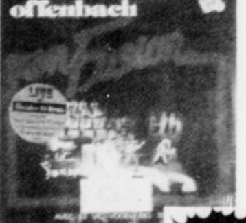
OFFENBACH en fusion Rég. $8.98 SPECIAL 7 18