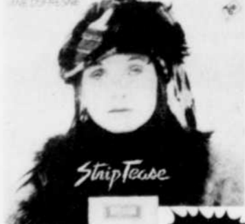
DIANE DUFRESNE STRIPTEASE Rég. $8.98 SPECIAL 7 18