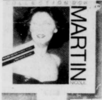
NICOLE MARTIN Collection d'or Rég. $8.98 SPECIAL 5 99