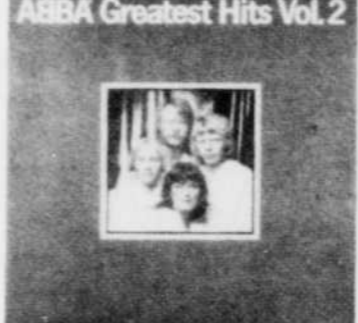
ABBA Greatest Hits Vol. 2 Rég. $9.29 SPECIAL 7 49