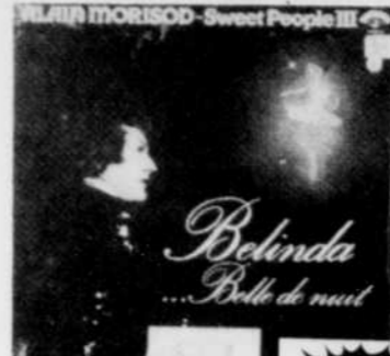
ALAIN MORISOD Sweet People III Rég. $8.98 SPECIAL 7 18