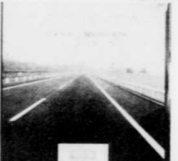
PAT METHENY New Chautauqua Rég. $9.98 SPECIAL 8 18