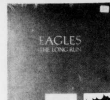
EAGLES The long run Rég. $9.29 SPECIAL 7 49