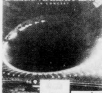
EMERSON LAKE PALMER in concert Rég. $8.98 SPECIAL 7 18