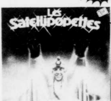
LES SATELLIPOPETTES Capitaine Cosmos Rég. $6.98 SPECIAL 5 18