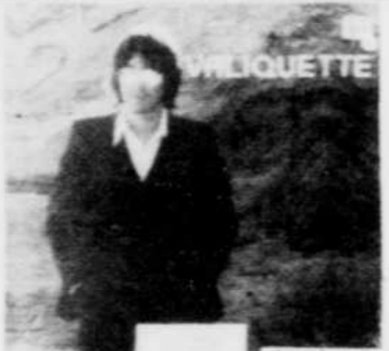
VALIQUETTE Rég. $8.98 SPECIAL 7 18