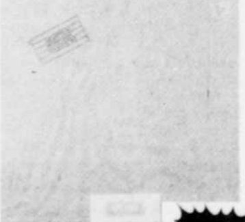
HEART Bébé le strange Rég. $9.29 SPECIAL 7 49