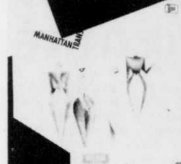
MANHATTAN TRANSFER Extensions Rég. $8.98 SPECIAL 7 18