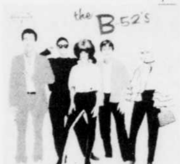
THE B-52'S Rég. $8.98 SPECIAL 7 18