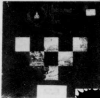
MUSIQUE DU QUEBEC Rég. $49.95 SPECIAL 39 95