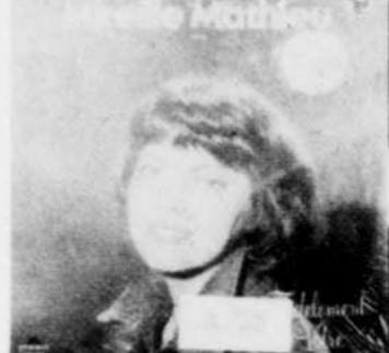
MIREILLE MATHIEU Fidèlement votre Rég. $8.98 SPECIAL 7 18