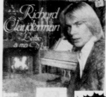
RICHARD CLAYDERMAN Lettre à ma mère Rég. $8.98 SPECIAL 7 18