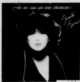
GINETTE RENO Je ne suis qu'une chanson Rég. $8.98 SPECIAL 6 49

AUX DISQUES Plus de 10,000 disques en spécial Prix en vigueur jusqu'au 5 avril. Aussi disponibles 8 pistes et cassettes.