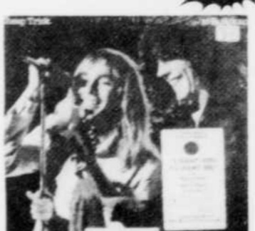
CHEAP TRICK AT BUDOKAN 'I want you to want me' Rég. $9.29 SPECIAL 7 49